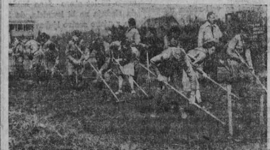
Na sliki vidimo slepe mladine, ki obdeluje vrtove v nevojškem institutu za slepce, ki ima v ta namen 15 akrov zemlja.