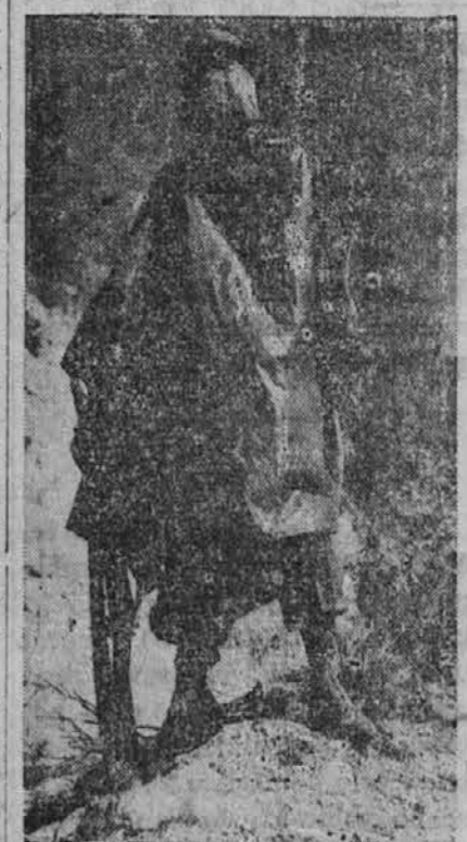
Na sliki je ameriški vojak, ki se bori v pacifičnih džunglah. Kakor je videti, ga štiti dežni plašč pred dežjem, mreža na obrazu pa pred piki komarjev.