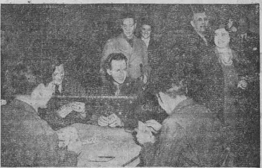
Na sliki vidimo angleško kraljico, ko je nedavno obiskala klubove prostore Rdečega križa v Angliji, kjer so si vojaki s kartami preganjali čas.

šel iz rok deželnega kneza v roke zemljiškega gospoda, tako da je kmet izgubil še svojo zaslobo, in ki se je kompliciralo z nastopanjem različnih upraviteljev in z njihovimi dohodki, ki jih ni bilo v starih urbarjih, so pa kmeta vedno bolj težile tudi posledice političnega položaja.