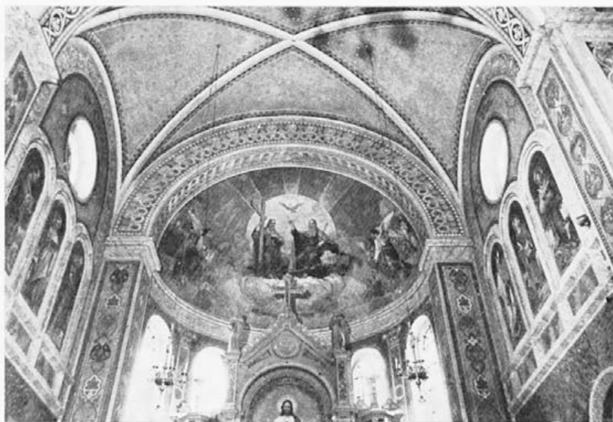
147 Janez Wolf : Ribnica, prezbiterij, 1880