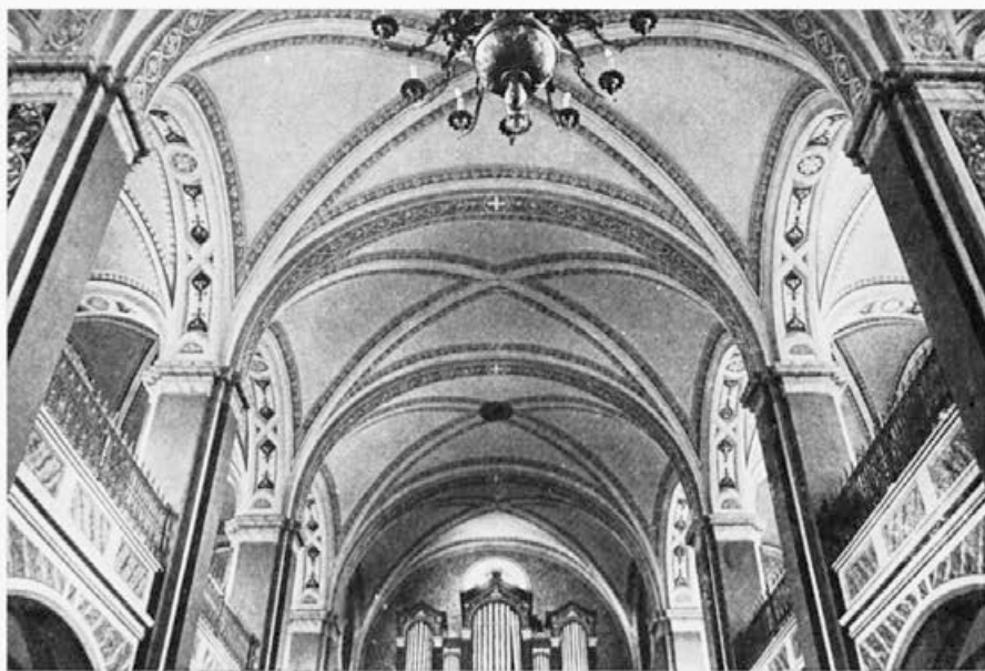
148 Matija Koželj : Ribnica, ladja, 1890