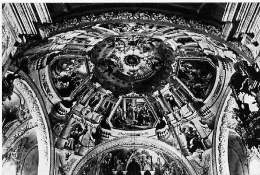
156 Jakob Brodlo : Ponikva pri Grobelnem, ladja, 1890