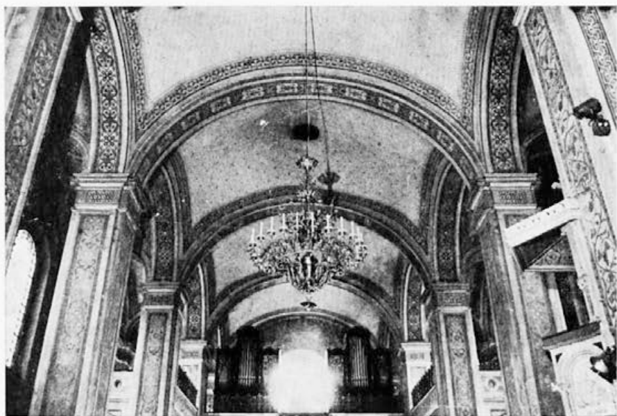
146 Simon Ogrin : Vrhnika, ladja, 1906—1907