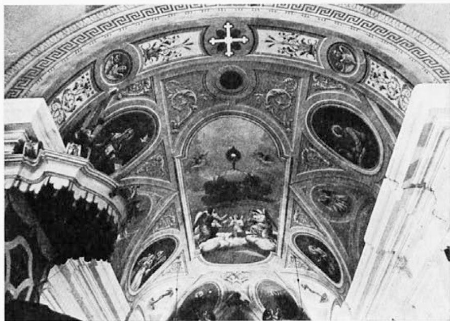
153 Simon Ogrin : Kamna gorica pri Radovljici, prezbiterij, 1904