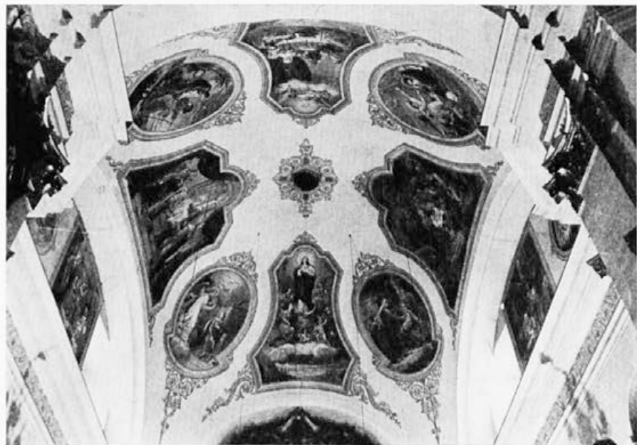
154 Matija Koželj : Cerklje na Gorenjskem, prezbiterij, 1889