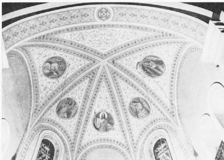
150 Anton Jebačín : Sora pri Medvodah, prezbitერიj, 1909