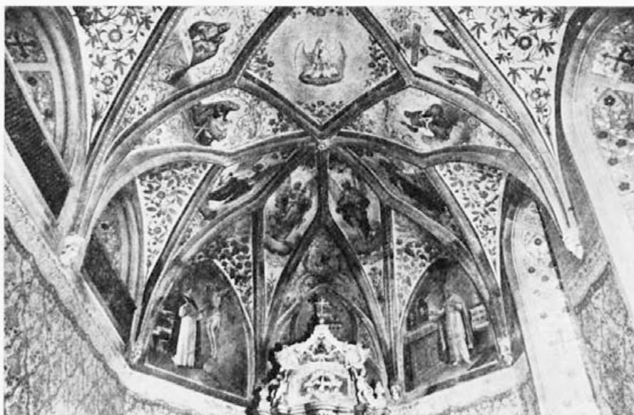
152 Anton Jebačič : Prosek pri Trstu, prezbiterij, 1919