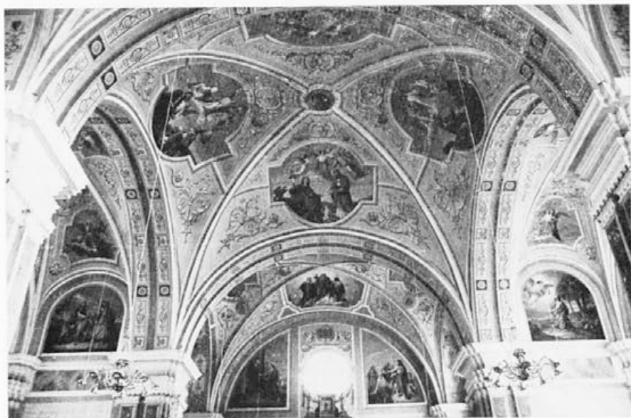
149 Matija Bradaška : Čadram pri Slovenskih Konjicah, pogled proti prezbitერიu, 1908—1910