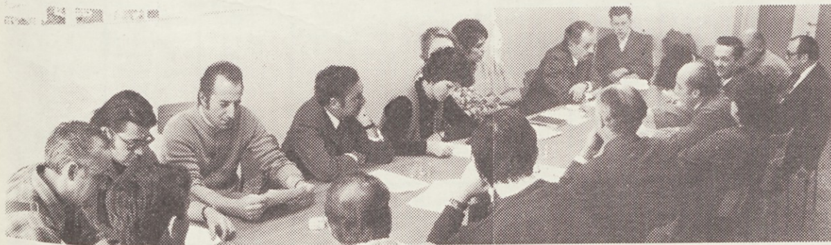
Zadnja seja centralnega delavskega sveta združenega podjetja Ljudske pravice

Druženopolitične organizacije obeh TOZD, samoupravni organi, vodstvo podjetja in uredništvo glasila želijo vsem članom delovnega kolektiva srečno in uspešno novo leto 1974!