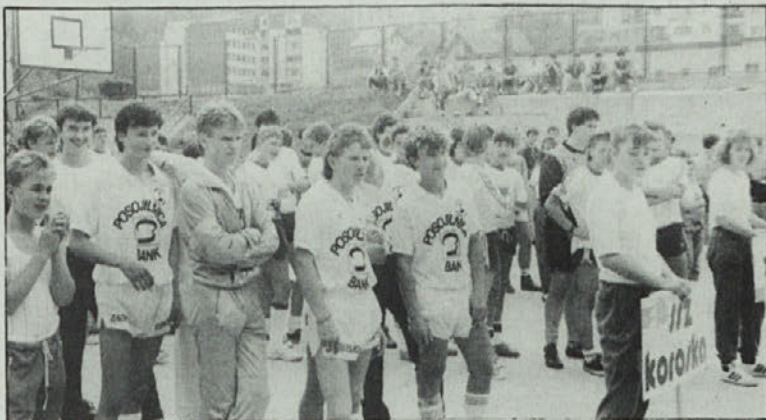
Koroški športniki v Hrastovniku

SAK — VOEST v sredo, 5. julija, ob 18. uri v Klopincu