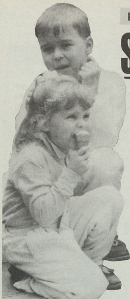
Otroci so imeli svoj program

Hemin jubilej je trajal tri leta. Prav tako je bil sklep Heminega jubileja deljen na tri dele. V petek že so se verniki vseh župnij krške škofije zvečer srečali v svojih tisoč župnijskih in podružnih cerkvah, da se v molitvi in pesmi pripravijo na naslednja dva dneva praznovanja sklepa Heminega jubileja. Srečanje dekanij v dvoranah mesta v Celovcu, srečanje otrok in mladine v centru Celovca, to je bil uvod v sobotni popoldanski škofov govor in predaje kruha ter vina zastopnikom fara, ki so te simbolične darove v nedeljo ponesli v razne župnije.