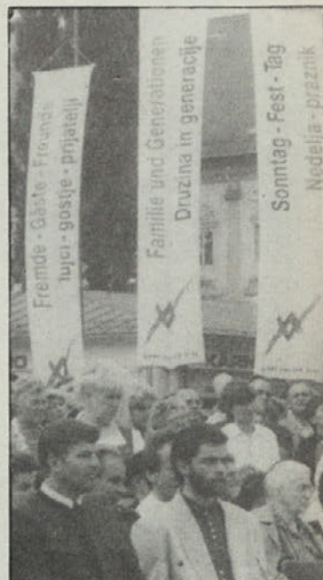
Dosledna dvojezičnost je bila tudi eno izmed odlikovanj katoliškega shoda v Celovcu.