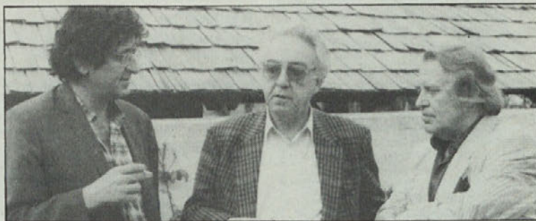
Trije „pristni“ Dunajčani na vrtu Mohorjeve. Z leve Robert Schindel, Milo Dor in Pavel Kohout. Pozdrav pisatelj je veljal predvsem kor. Slovencem.