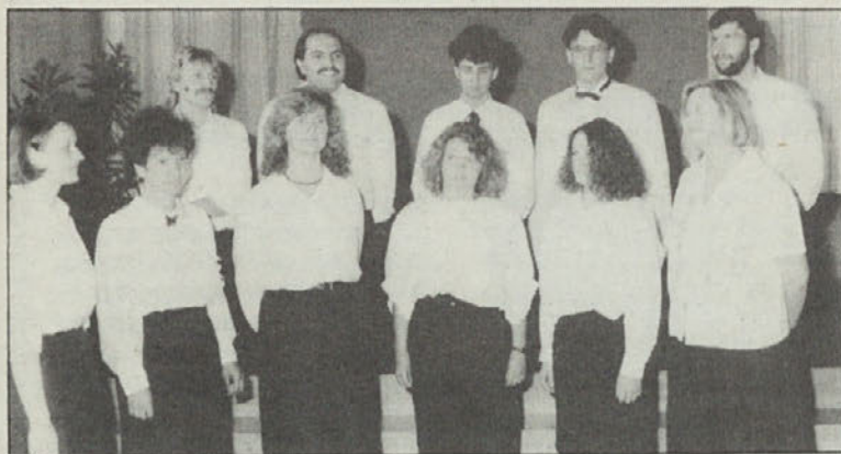
Udeleženci zborovodskega tečaja GŠ pri enem izmed svojih nastopov. Ponsnetek je s srečanja sosednjih zborov v Kotmari vasi.