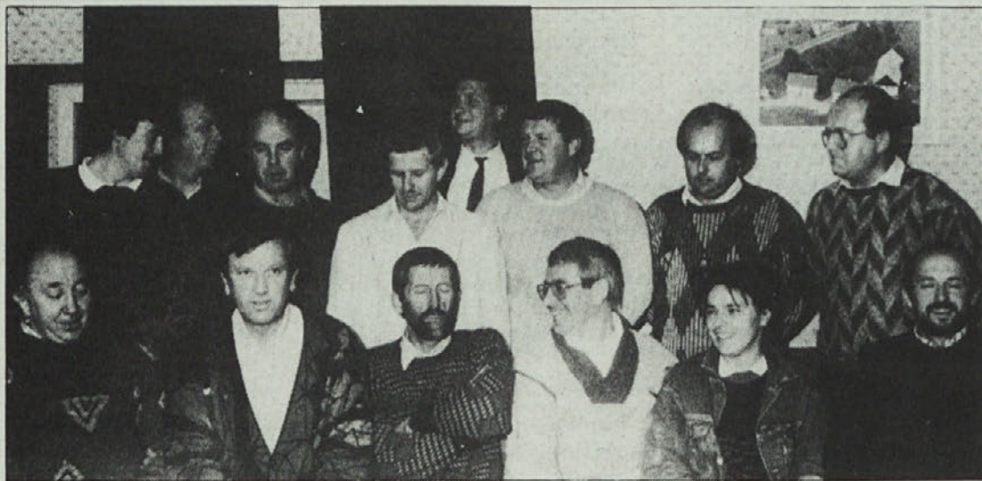
Odborniki ŠD Šentjanž so v preteklih letih zelo veliko storili za društvo, ki danes lahko ponosno in tudi z velikim športnim uspehom praznuje 40-letnico.