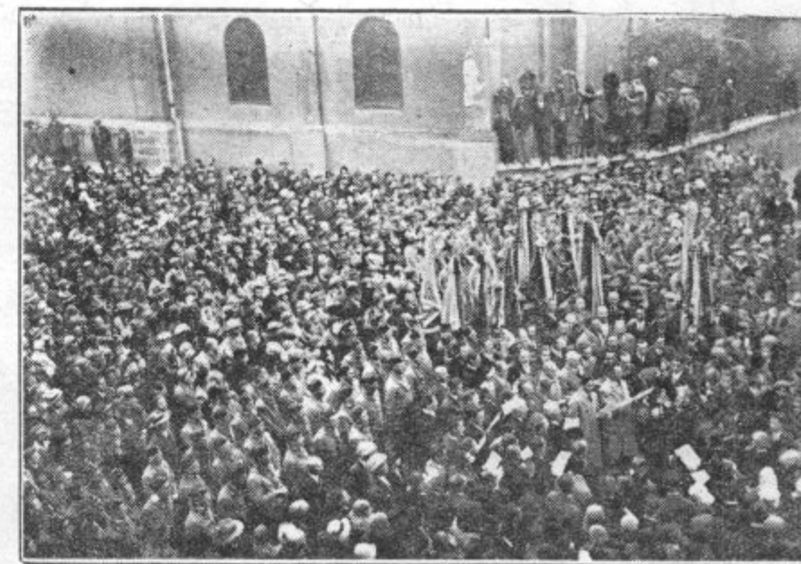
Združeni pevski zbori pojo pred Unionom v pozdrav visokemu gostu