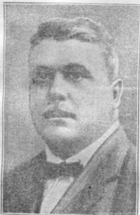
Inž. Dušan Serbec, minister za šume in rudnike