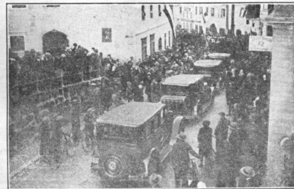
Ob prihodu g. predsednika in članov vlade v Kamnik