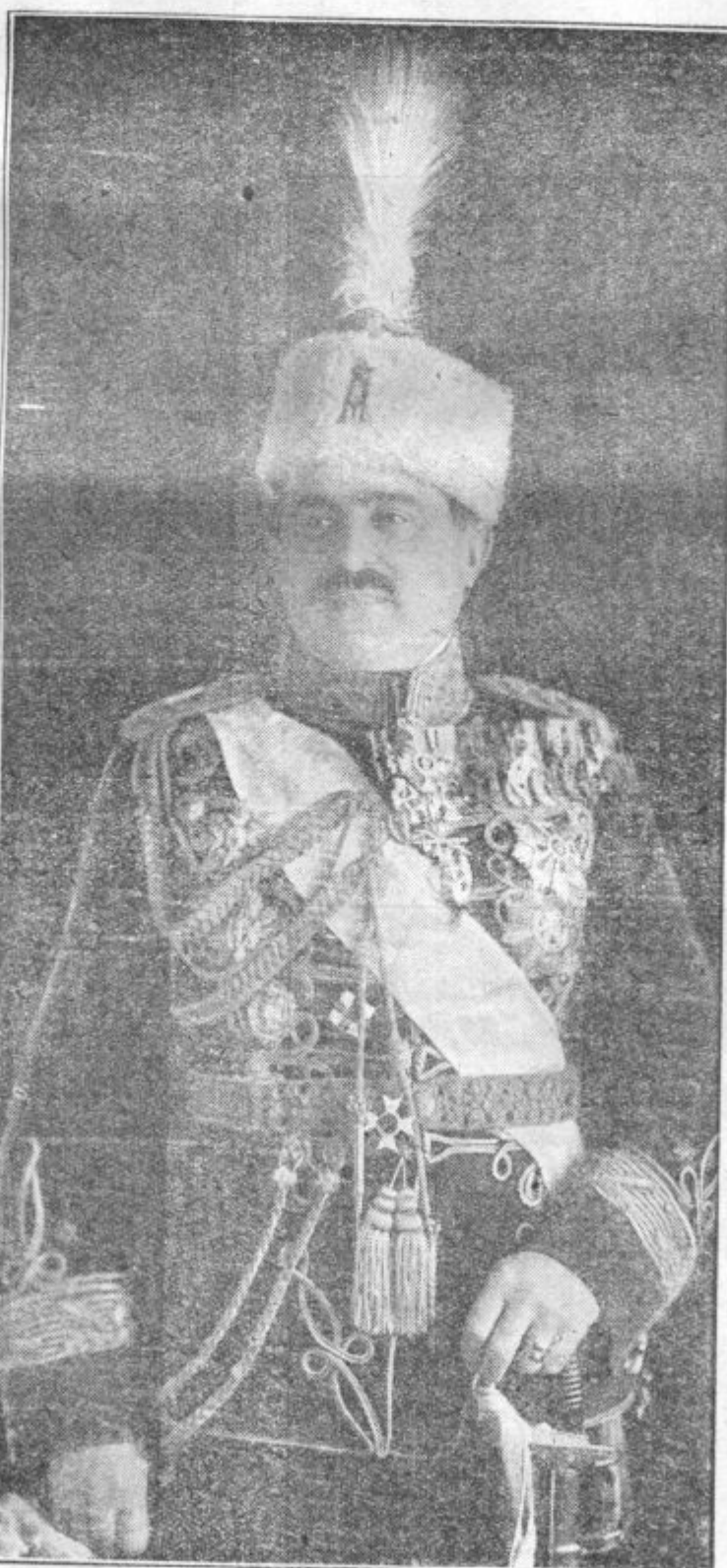
Predsednik vlade g. Peter Živković v svoji uniformi kot komandant kraljeve garde