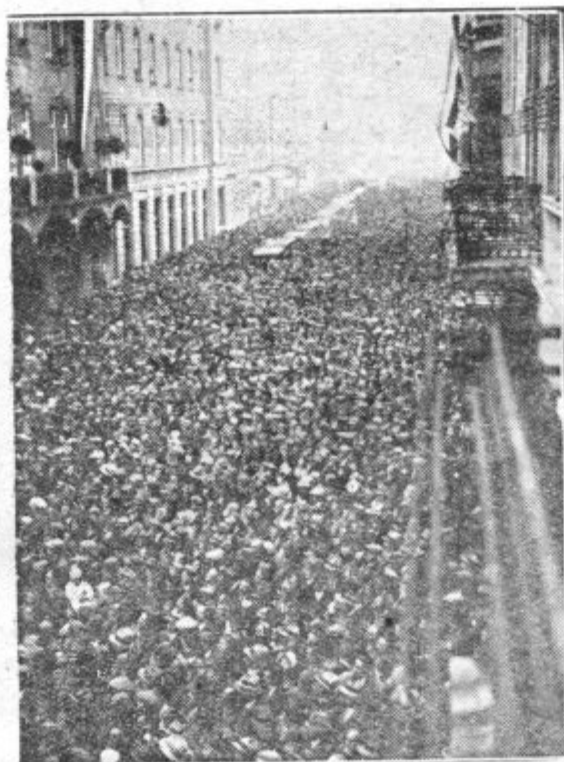
Pogled na Miklošičevo cesto ob prihodu g. predsednika vlade s kolodvoru v hotel »Union«.