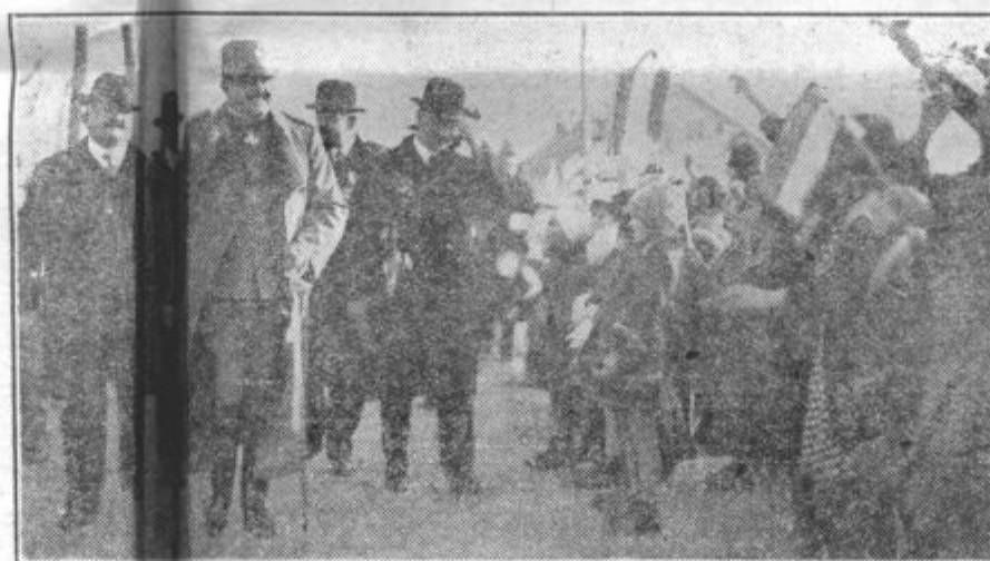
Prisilnik vlade in ministri toplo pozdravljeni v Zgornji šiški