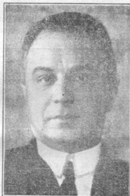
Dr. Milan Srškić, minister pravde