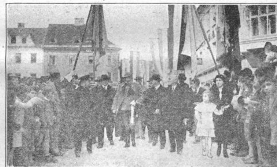
Ves Kranj je navdušeno pozdravil visoke goste