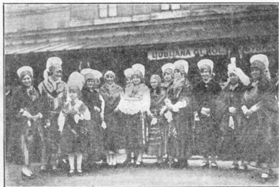
Dame v narodnih nošah pričakujejo visokega gosta