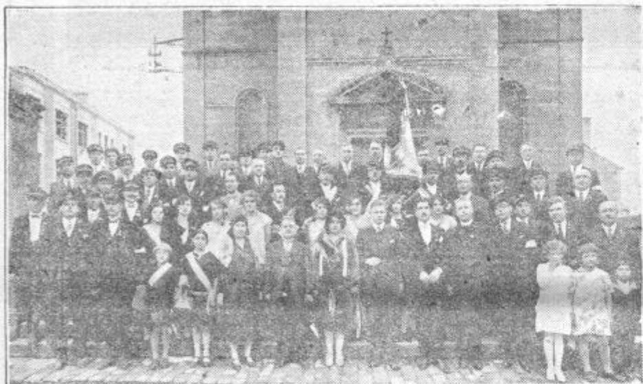
Častni odbor društva z društveniki in predsedniki udeleženih društev.