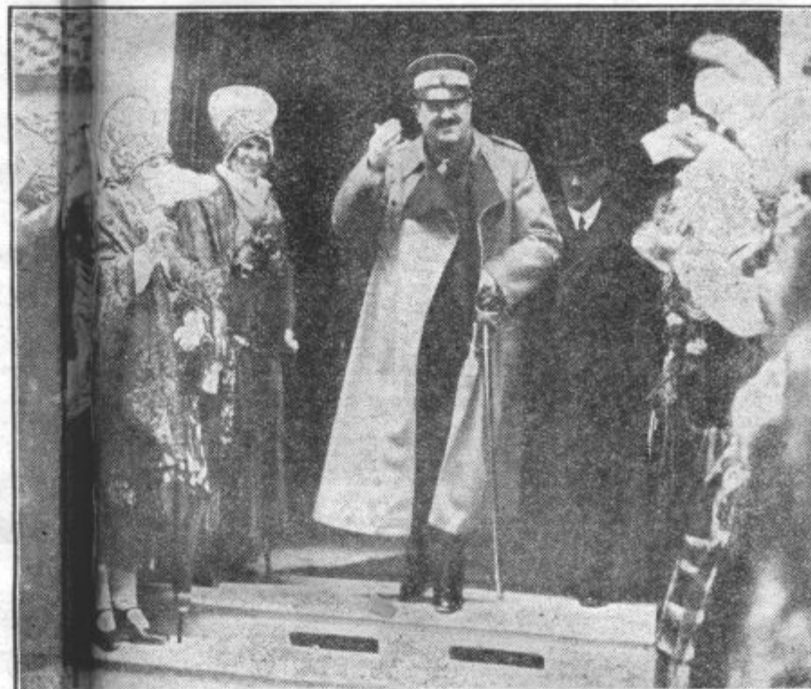
Prisilnik vlade odhaja s slavnostne seje ljubljanskega občinskega sveta