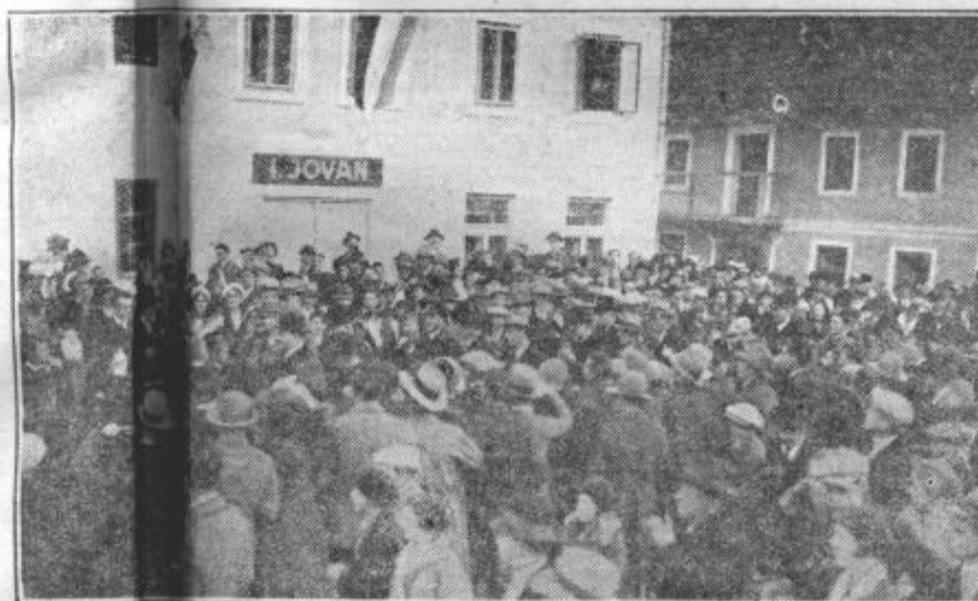
Prizor ob sprejemu članov vlade v št. Vidu