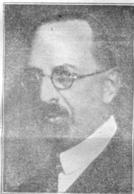
Dr. Stanko Šverljuga, finančni minister