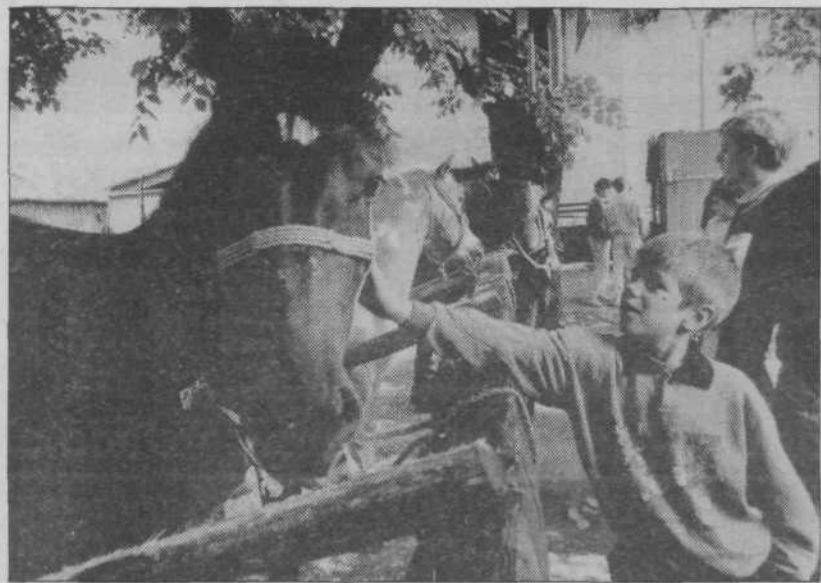
Otrokom so bile na kmečkem prazniku najbolj všeč kobile in žrebeta