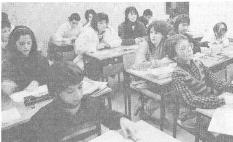
Ti učenci Glasbene šole Ljubljana Vič-Rudnik imajo starše in njihovi starši imajo prijatelje. Prav bi bilo da bi vsi skupaj, pa tudi drugi ljubitelji glasbe, napolnili dvorano ob vsakem javnem nastopu. Hvaležni jim bodo mladi glasbeni poustvarjalci in njihovi pedagogi.