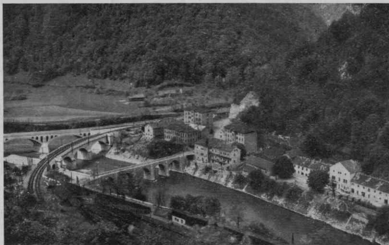
Pogled na Zidani most (posnetek izpred II. svetovne vojne)