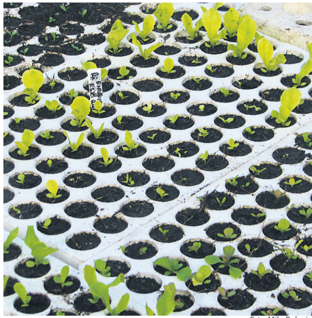
Takšna slika kaže na slabo energijo semena solate, čeprav je kaljivost zadovoljiva.

Čistoča semena seveda ne pove, kako je seme čisto ali umazano z zemljo ali prahom. Čistoča semena je kategorija, ki pove, koliko je v semenu tujih primesi. Te primesi so lahko tako semena tujih rastlin kakor