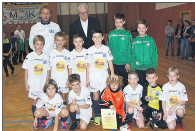
Ekipa NŠ Poli Drava U-9