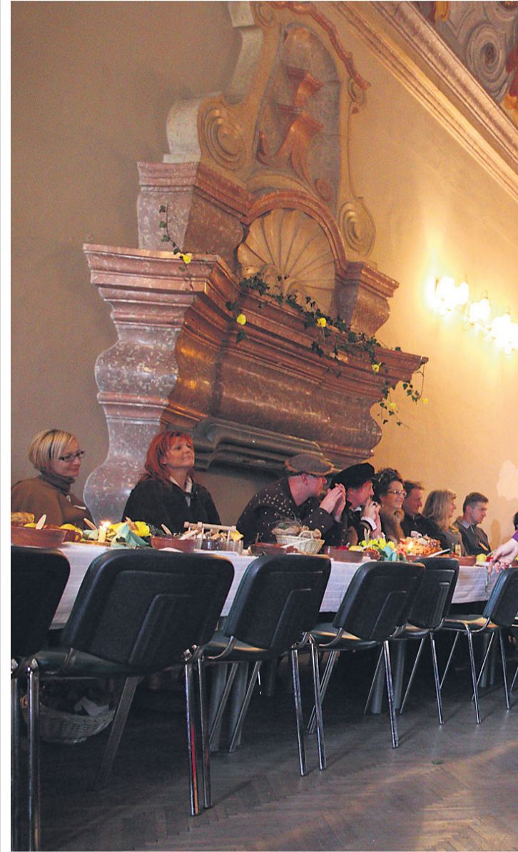
Sloviti dornavski cigani bodo letos na Fašenku po dornavsko pesali pod t počeli v baročnem dvorcu, katerega ključki so še vedno v Ljubljani.