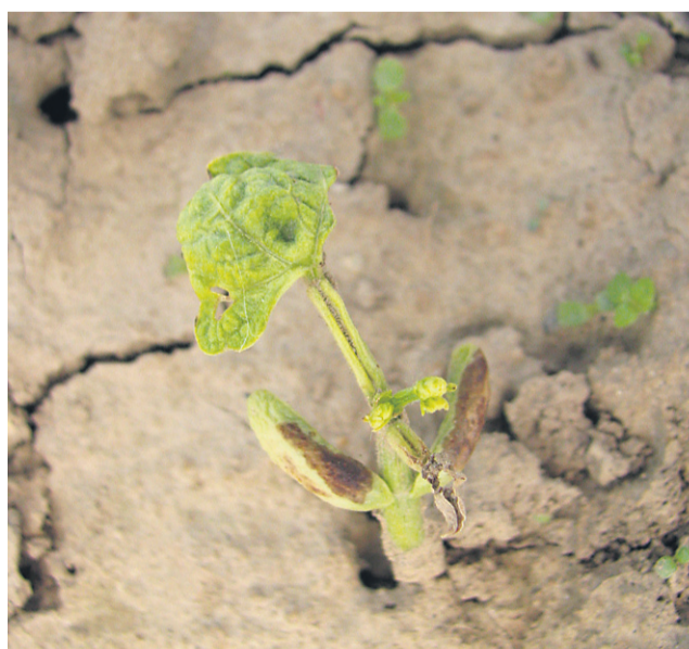
Vidimo, kako je okužba na semenu ovirala kaljivost semena fižola.

mrtvih primesi – smeti. Tukaj je zakonodaja pri vrtninah še bolj ohlapna. Vendar na srečo zelo veliko semena vrtnin pobremo ročno, zato ni toliko težav pri tej kategoriji pri kupljenem semenu. Zelo veliko težav pa vidim tukaj pri domačem pridelovanju semena, kjer ga ne znamo in pogosto tudi ne zmoremo dobro počistiti. Potem pa ga hranimo skupaj s plevicami, neočiščenega. Vedeti je treba, da še več glivic preživi na plevicah kakor na samem semenu. Če se seme pred hranjenjem ne očisti dobro, se seveda te bolezni še hitreje širijo tudi na samo seme. Zato vedno hranite čim bolj očiščenemu semenu. Še večja nevarnost pa je slaba čistoča pri domačem pridelanem semenu žit. Sam kombajn seveda ne očisti veliko semena. Enako veliko in enako težko seme plevelov ostane skrito med žlahtnim semenom žit. Kasneje ga seveda ponovno posejemo, s tem pa posejemo tudi seme plevelov. Zato je treba doma pridelano seme žit vedno še dodatno očistiti na selektorjih doma, očistiti bolje tudi kombajn pred žetvijo, za seme pa izbrati žetev iz najbolj čiste njive brez plevelov.