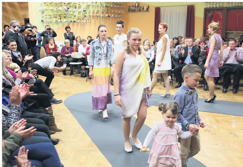
Z modne revije ob koncu projekta Barvanje tekstila z naravnimi materiali