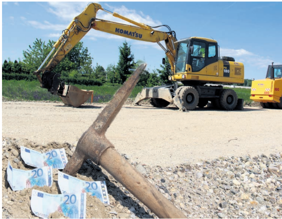
Župan Vindiš računa, da bodo denar, privarčevan z ukinitvijo Gradnj Destrnik, namenili za nakup strojev ali materiala za vzdrževanje komunalne in cestne infrastrukture. Fotografija je simbolična.

Makole • Zamrznjeni hidranti otežili delo gasilcev ob požaru