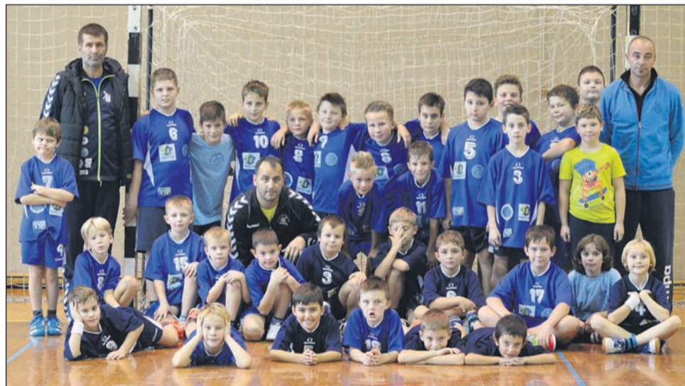
Mlajši dečki C Jeruzalema Ormoža & V. Nedelje Carrere Optyl