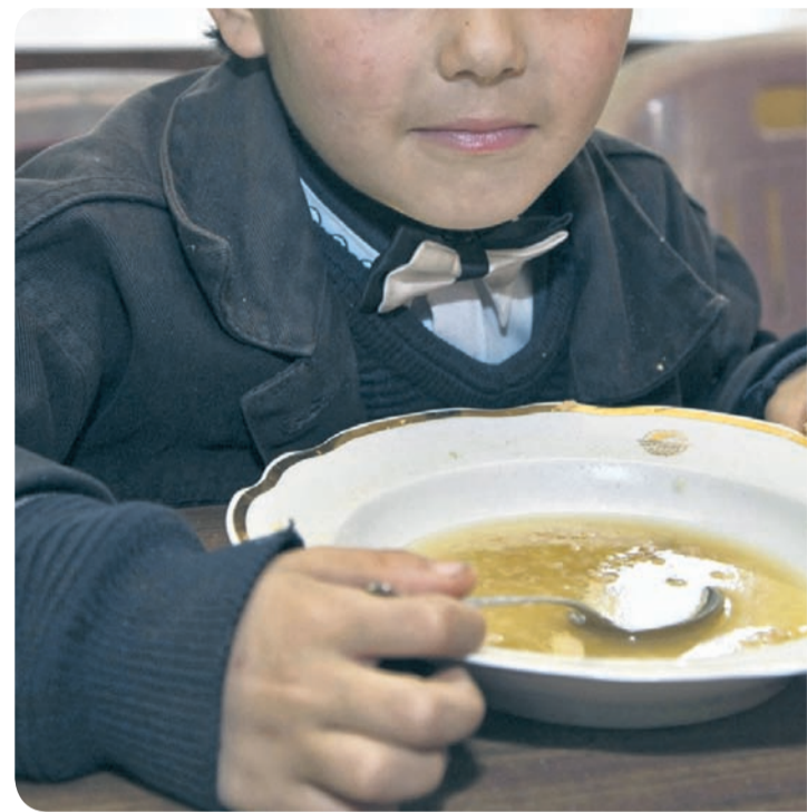
Vse več je tistih, ki nimajo niti za krožnik tople juhe s kosom kruha dnevno.

Vključeni v projekt si bodo prizadevali, da bi vsi, ki jim bo zagotovljen brezplačen topel obrok, tega v določenem loka-