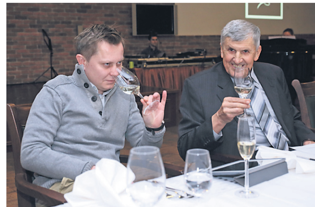
V letu 2015 se je prva predstavila Ptujška klet.