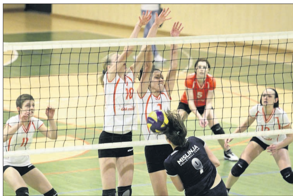
Ptujske odbojkarice so tudi proti Celjankam odigrale dobro srečanje, popustile so le v tretjem nizu.

Ptujske odbojkarice v zadnjih tednih zaradi zaprtja športne dvorane Gimnazije Ptuj trenirajo nekoliko manj kot običajno, a kljub pomanjkanju vadbe kažejo dobre predstave na igrišču. Tokrat so v športni dvorani Center igrale z nepopustljivo ekipo Celja. Gostje so se celo tekmo zelo borile za vsako žogo