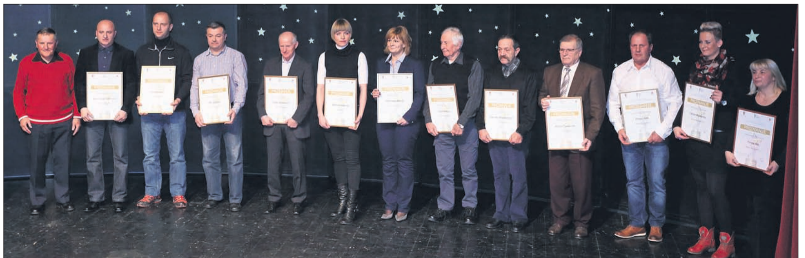
Letos je bilo podeljenih 13 priznanj za zaslužne športne delavce.

leta MO Ptuj. »Moja ocena je, da je za Ptuj privilegij, da ima toliko dobrih športnikov, zato sem vesel nagrade. Delo športnikov je, da tekmujejo v duhu fair playa, strokovnjaki pa to ocenjujejo in tudi razvrščajo rezultate. Odlično je, da je konkurenca tako dobra. Sam se med športniki vedno dobro počutim, dajejo mi dobro energijo, ki je potrebna za sezono, v kateri si želim doseči še kaj več kot lani, ko sem se precej časa ubadal s poškodbo. Upam, da se z oktobrsko zmago proti Hafnerju začneja boljše obdobje in da bom čim prej stopil na začrtano pot,« je povedal boksarski šampion, od katerega lahko pričakujemo »zanimivo« sezono.