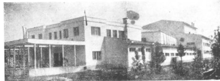
Kulturni dom v Kreki (BiH)

iste zelo strogi. Povsod vlada velik interes za napredek. To se odraža tudi na drugih vrstah dejavnosti, kar kaže kako močan vpliv ima takšno progresivno hotenje rudniškega kolektiva na svoje okolice. Kot primer naj navedemo to, da je ravno v času obiska bil v tem mestu velik telovadni nastop, na katerem je sodelovalo 2500 telovadcev iz Kakanja in okolice. Direktor tega rudnika je našim tovarišem rekel, da zelo mnogo rudarjev sodeluje pri nastopanju. Na vprašanje, kako je uspelo pridobiti tolikšno število ljudi za telovadbo in šport je odgovoril, da sami funkcionarji aktivno tekmujejo in to vleče.