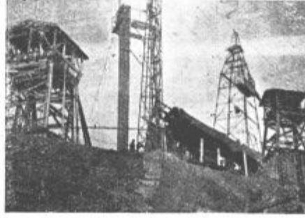
Industrijske naprave v Kreki

lektivni resno trudijo, da zamenjajo že zastarele in tradicionalne oblike in metode dela z novimi, sodobnejšimi, to se pravi, s takimi, ki ga bodo postavili v enako vrsto z drugimi v zamejstvu na domačem in zunanjem trgu. Z zadovoljstvom ugotavljaš, da je tudi tem »južnim« kolektivom jasno in razumljivo, da le dvig storilnosti dela pomeni siguran dvig življenjske ravni našega delovnega človeka. To je osrednji pro-