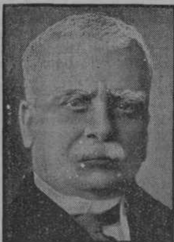
Aleksander Zaimis. Na Dunaju je umrl 79letni Zaimis, zadnji predsednik grške republike.

Dogodki v Španiji dajejo Evropi še nek drug dragocen nauk, ki bo lahko prinesel dragocene sadove. To je resnica, ki je zdaj postala vsem jasna, tudi tistim, ki so prej bili udarjeni s slepoto. In ta resnica je: edina prava ovira boljševiškega nauka in dela je krščanski nauk ter krščansko življenje, kakor ga uči in zahteva katoliška cerkev. Kdor se proti katoliški cerkvi in veri bori in se trudi, da bi preprečil njene blagodejne učinke na posameznika, na družino, na narod in na državo, ta se nehote pridružuje prevratnim silam boljševizma z istim žalostnim uspehom za človeško družbo in za lasten narod. Boljševizem je mogel doseči svoje uspehe le, ker mu je pripravil tla oni liberalizem, ki je ločil med katoliško vero in političnim udejstvom, hoteč vero izpremeniti v golo nabožništvo, ne da bi ji pustil svobodo, da se izdejstvuje po svoji zveličavni morali in njeni posvečujoči sili tudi v družabnem organizmu družine, občine, države, naroda in tako dalje. Kdor stavlja ovire polnemu razvitku krščanske vere v dejanskem življenju ljudstva, ta pospešuje in odpira pot vplivu in delovanju prevratnih sil sodobnosti.