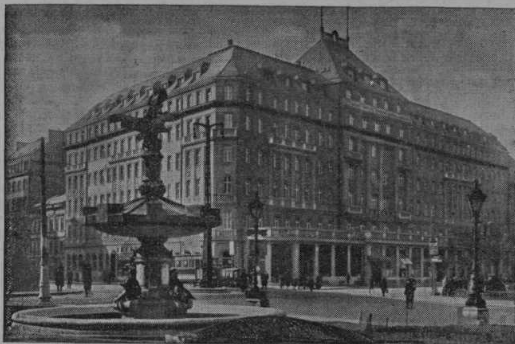
Palaca v Bratislavi, v kateri je bilo zadnje zasedanje Male zveze.