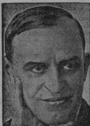
Svetozar Pribičević †.

spregjeli načela boljševiške propagande; naj se pridružijo samo njegovemu praktičnemu delu na gospodarskem in socialnem polju. Kakor da bi bilo mogoče ločiti gospodarski red od moralnega reda in sodelovati na praktičnem polju s to pogubno zmoto brezbožnega socializma, ne da bi se navzeli njegovega brezbožnega nauka! Ta propaganda se je kakor volk preoblekla v ovčjo kožo, hlinič nekako strpnost do katolicizma samo za to, da prevari in razoroži kristjane in ves svet, da bi ga lažje razrušila. To vidimo sedaj na zgledu Španije, kar je pač izmodrilo vse katoličane, ne pa še ostalega sveta.