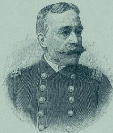
Kommodore George Dewey, poveljnik ameriškega brodogoja, zmagovalec pri Manili.

Palackega slavnost v Pragi. Sredi minulega meseca so praznovali Čehi z ve-