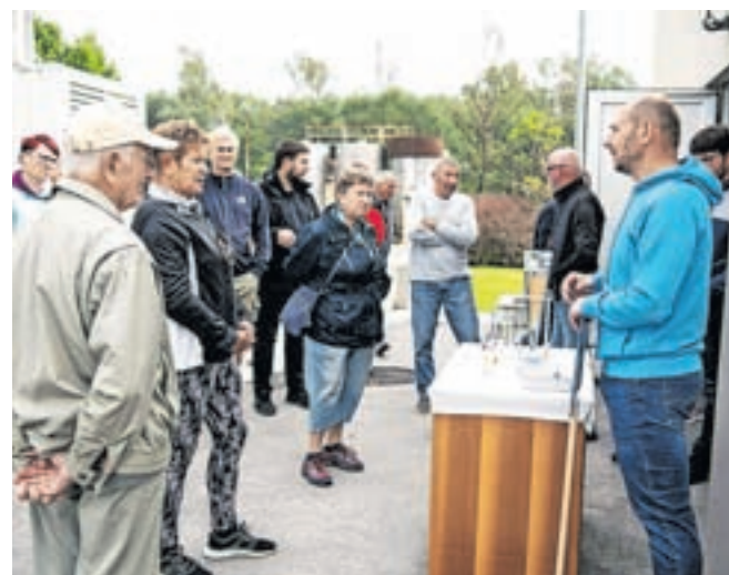
Dneva odprtih vrat se je udeležilo okoli dvesto obiskovalcev.

dala direktorica, bo v prihodnjem desetletju tako treba čistilno napravo nadgraditi na četrto stopnjo čiščenja. »Iz odpadne vode, ki je zdaj prečiščena 96-odstotno, bo