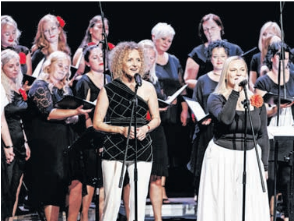
Na koncertu Sirene spet pojejo

dodala, da nikoli ne reci nikoli. Tako so se po 14 letih članice ponovno zbrale in znova stopile na oder. Da jih v tem času poslušalci niso pozabili, kaže tudi razprodana dvorana kamniškega doma kulture. Ponovitev sledi 29. novembra.