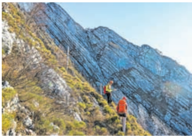
V gorah Karnijskih Alp