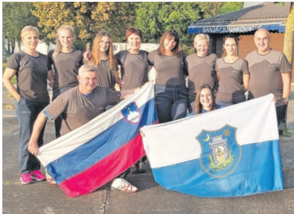
Kamniški kegljači so odlično nastopili v Apatinu.