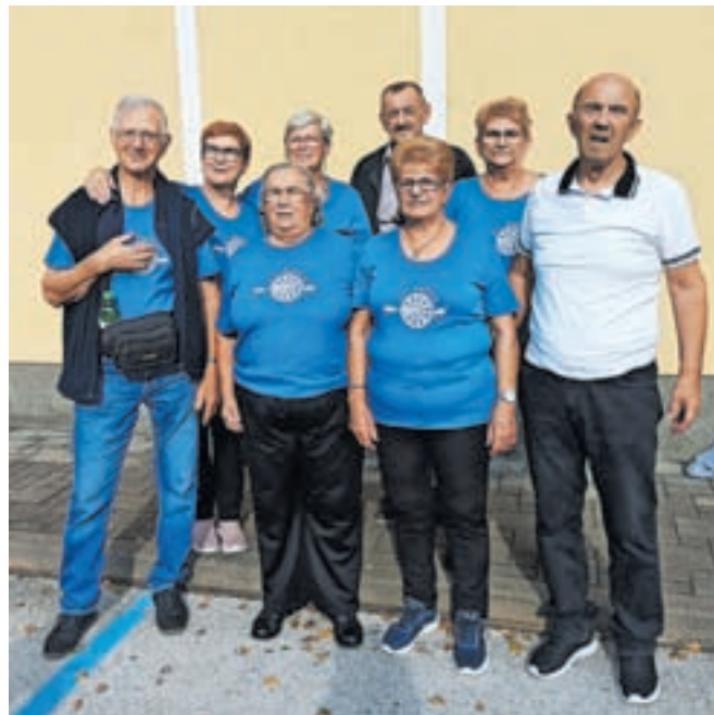
Kamniški udeleženci tekmovalja

Letošnje državno prvenstvo je bilo v sredo, 4. oktobra, v Škocjanu na Dolenjskem.