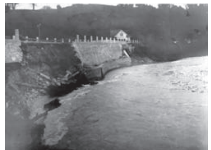
Cesta v Stranjah