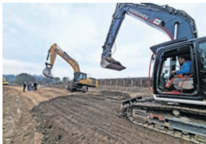
Na območju Šmarce gradijo nasip v dolžini tristo metrov.

Kot so ob tem sporočili s kamniške občinske uprave, nasip gradijo iz gramoznega materiala in tesnijo z glinenim jedrom. »Centralno glinasto jedro je širine en meter na koti krone in globine približno 1,5 metra oziroma do kote talne vode. Vgradnja glinice se izvaja v plasteh z ustreznim komprimiranjem,« so še sporočili. Dela izvaja podjetje Hidrotehnik. Projektantska ocena stroškov intervencijskega nasipa znaša 672.179 evrov.