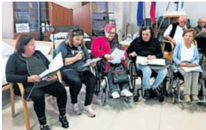
Članice recitatorske skupine Društva paraplegikov ljubljanske pokrajine