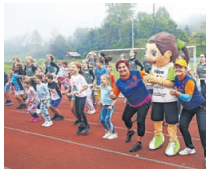
Dan slovenskega športa na Osnovni šoli Frana Albrehta

Z učenci šestih razredov in nekaterimi drugošolci smo se srečali v športni dvorani, kjer smo s pomočjo starejših učenek in Vihre, simpatične maskote projekta Veter v laseh, pripravili in zaplesali simpatičen skupinski ples.