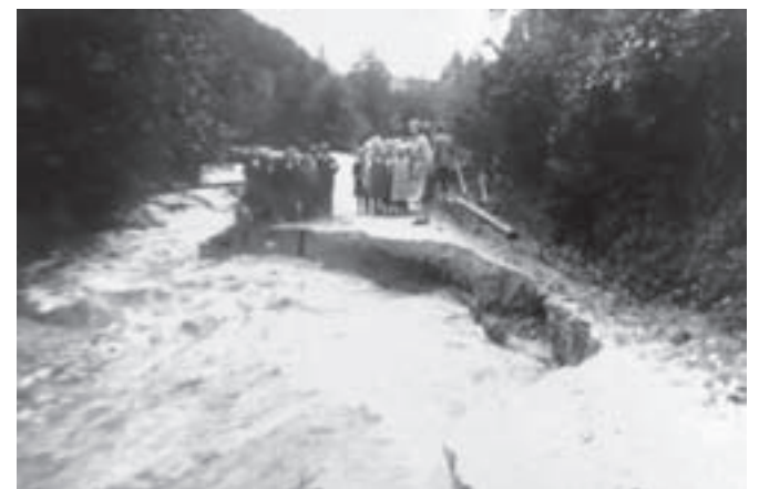
Na obrežju Bistrice v Stranjah

Pisali so tudi o res nujni regulaciji: »Razmere nas silijo, da se regulacije resno popri-