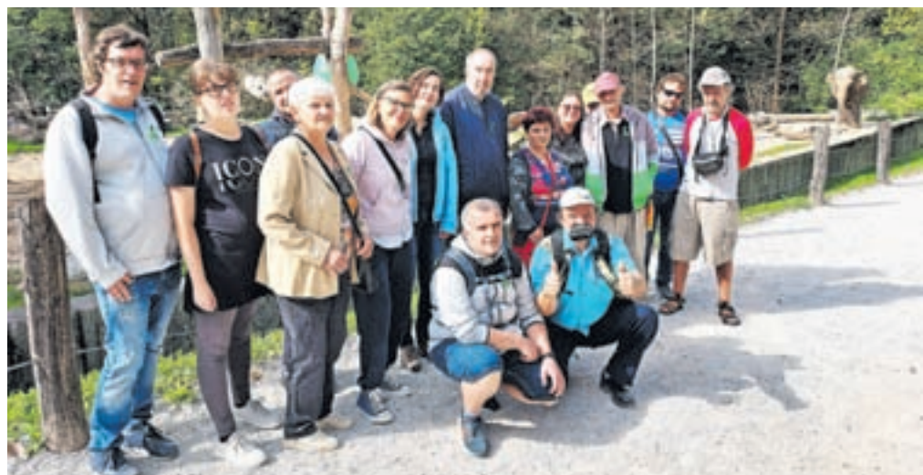
Uporabniki DC Štacion so obiskali ljubljanski živalski vrt.