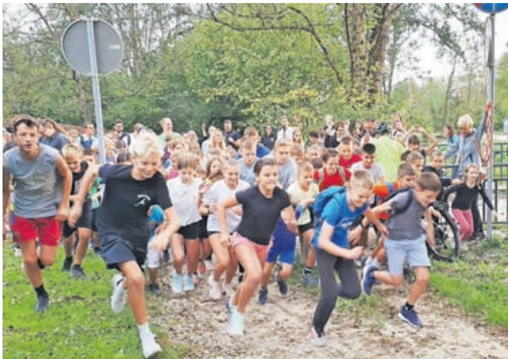
Okoli tristo tekačev in pohodnikov se je podalo po obnovljeni sprehajalni poti.

Tekače in pohodnike je ob poti tokrat pričakal duet Mark in Nace, ki sta dobro voljo in energijo delila s harmoniko in kitaro, ko smo se približevali cilju, pa so nam dodatno energijo dajali takti poskočnih melodij Mestne godbe Kamnik. V cilju je vsak udeleženec prejel zaslužen nagrado za premagano pot – vrhunske tekaške nogavice priznanega proizvajalca športne opreme. Za dogodek, ki spodbuja gibanje in medgeneracijsko druženje, so učenci pod mentorstvom učiteljice Teje pripravili predstavitvene plakate, zdrave prigrizke in sveže sadje za vse udeležence. S tem smo poča-