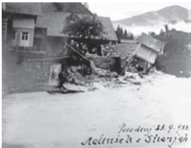
Posledice povodnji pri Malenškovih v Stranjah

zemljišč, prestavila na mnogih mestih strugo in ogrožala hiše in številna industrijska podjetja vzdolž struge.« Nekateri problemi so očitno večni.