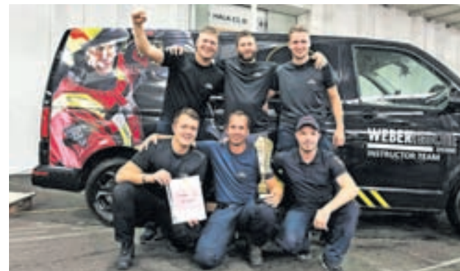
Kamničani so na tekmovanju osvojili tretje mesto.