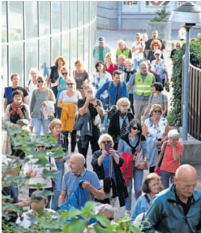
Skozi središče mesta se je sprehodilo precejšnje število krajanov.

Kot nam je povedala predsednica krajevne skupnosti Ivanka Učakar, si krajanje prizadevajo za celovito obnovo kompleksa Malega gradu, med dolgoročnimi načrti pa je tudi ureditev rojstne hiše Franca Pirca, ki jo je občina odkupila pred nedavnim. »Hiša je zelo pomembna za oživitve rova pod Malim gradom, v krajevni skupnosti pa upamo, da bi tam lahko