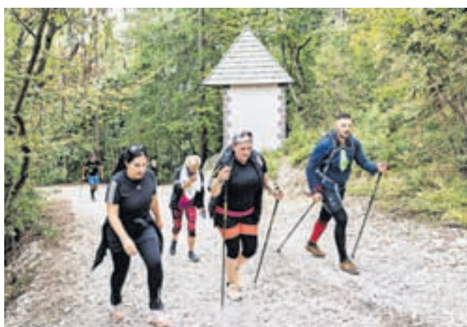
Na dobrodelnem pohodu so tokrat zbirali sredstva za družine, prizadete v avgustovskih poplavah.

deset tisoč evrov, ki jih bodo s pomočjo Zveze prijateljev mladine Slovenije razdelili družinam, prizadetim v avgustovski ujmi. Dobrodelni pohod na sv. Primoža so pri Modrih novicah pred desetimi leti osnovali