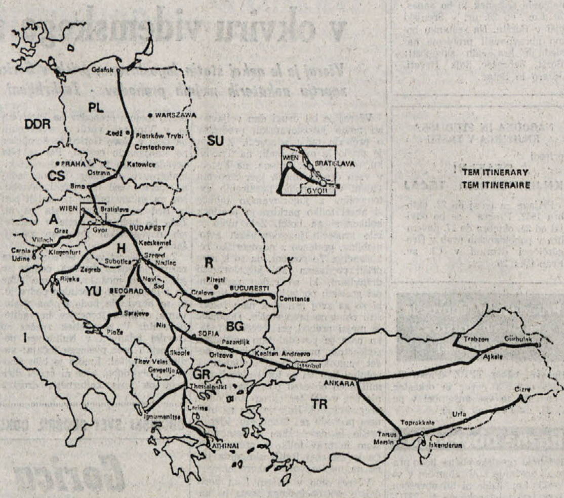
TEM ITINERARY TEM ITINERAIRE

TEM, Trans European Motorway je verjetno najbolj ambiciozen načrt v Evropi na področju gradnje novih avtocestnih povezav. Gre namreč za dolgo avtocesto v smeri sever jug vzhodno od vseh obstoječih zvez, katere namen je, da doprinese k smotrnejšemu razvoju manj razvitih evropskih držav in poveže Evropo s Srednjim vzhodom. Ta avtocesta, ki bo merila skupno 10.000 kilometrov, bo tekla od poljskega pristanišča Gdansk do meje med Turčijo in Iranom. S nekaterimi odcepki, ki bodo novi evropski sistem povezovali z obstoječim zahodnoevropskim avtocestnim sistemom: tu gre predvsem za odcep Dunaj - Beljak - Videm, ki je tudi edini del te avtoceste, ki zahodnoevropskih deželah, če se veda izvzamemo grški in turški del avtoceste.