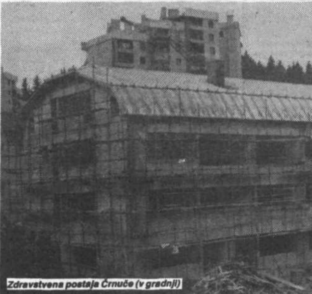
Zdravstvena postaja Črnuče (v gradnji)