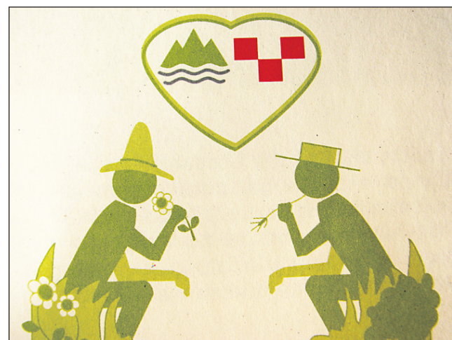
Zanimiv logotip soodvisnosti ljudi pri skrbi za čisto površinsko in podzemno vodo na obeh straneh meje