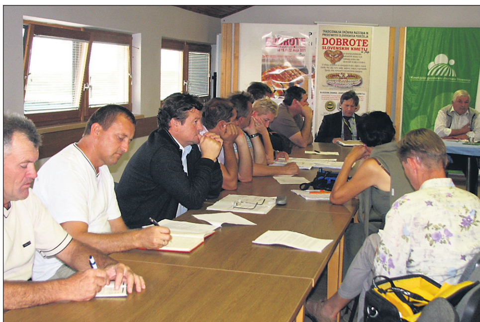
Na zadnji seji OE KGZS Ptuj so govorili le o težavah v kmetijstvu - tako tistih še nerešenih kot novih.

Padlo je tudi vprašanje o vzroku pomora čebel na nekaterih prekmurskih njivah. Vsaj del vedno bolj glasnih govoric, ki pravijo, da je šlo izključno za njive Panvite, kjer naj bi bilo seme, uvože-