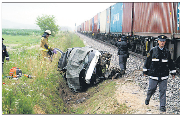
Nezavarovani železniški prehod pri Borovcih je 24. junija letos zahteval življenje 24-letnega mladeniča iz Rotmana pri Juršincih.

»Tehnologije, ki se zelo hitro razvijajo, so dobrodošle tudi pri varovanju na nivojskih prehodih, vendar le v primeru temeljitega spremljanja njihovega delovanja, predvsem pa učinkov v povezavi s človeškim faktorjem, kjer pa poznamo veliko primerov obje-