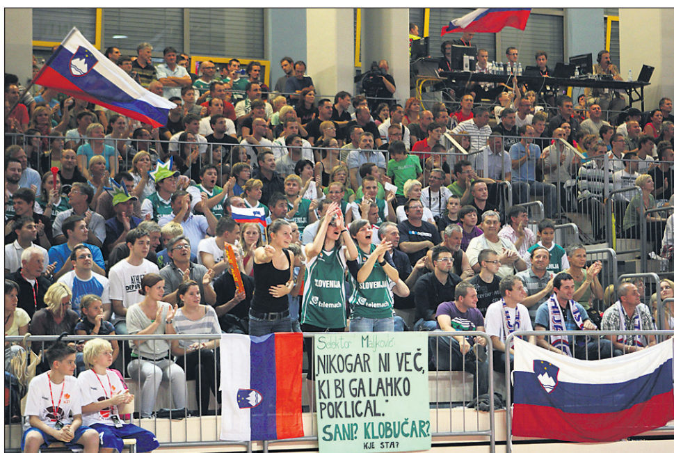
Bo Ptuj gostil organizacijo ene skupine prvega dela EPK 2013 ali si bodo mestni svetniki še premišljevali?

Statutarno-pravna komisija MO Ptuj je podprla pre-