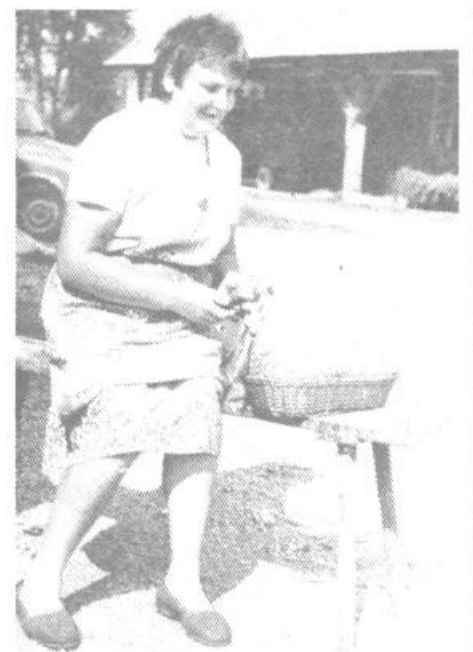
Klekanje je tudi na Samotorici eden najljubših konjičkov