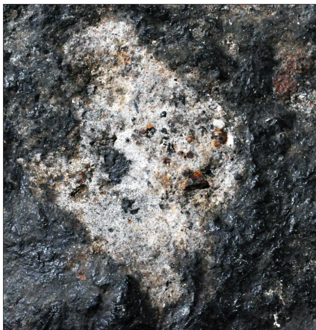
Sl. 4. Drobnji kroglasti fragmenti so mestoma obdani z limonitom, kar spominja na hondrule, ki so sicer značilne za kamnite meteorite hondrite. Na tem kosu feromangana so zelo verjetno sekundarnega nastanka, saj so opazni samo na površini, detajl meri 1 x 1 cm.

Fig. 4. Small spherical fragments are sometimes surrounded by secondary iron minerals that resemble chondrules, which are otherwise characteristic of stony meteorites chondrites. In this piece of ferromanganese, these spherical fragments are probably of secondary origin, since they are only visible on the surface, detail 1 x 1 cm.