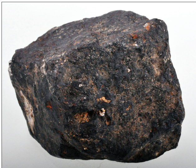
Sl. 1. Neobičajno težek kos domnevnega meteorita je našel zbiratelj Sandi Stopar in vzorec predal v raziskave Prirodoslovnemu muzeju Slovenije. Dimenzije primerka so 9 x 7 x 7 cm in masa 1608,78 g.

Fig. 1. Abnormally heavy piece of suspected meteorite was found by collector Sandi Stopar who brought the piece for investigation to the Slovenian Museum of Natural History. Dimensions of the sample are 9 x 7 x 7 cm and weight of 1608.78 g.