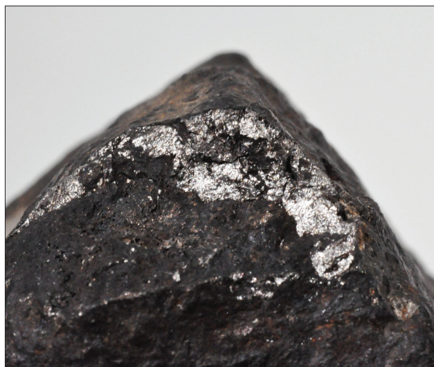
Sl. 3. Na odlomljenem delu je prepoznavna sveža srebrnkasto bela površina s kovinskim sijajem, kar je značilno tudi za železovo nikljeve meteorite, obenem pa je opazna tanka skorja čokoladne rjave barve, ki je pri meteoritih posledica žarenja pri padanju skozi atmosfero, detajl meri 3 x 2 cm.

Fig. 2. Sample of the presumed meteorite shows similar morphological characteristics as those of some oriented iron meteorites. The figure below plots the idealized hexahedron, which is truncated by the plane of the octahedron.