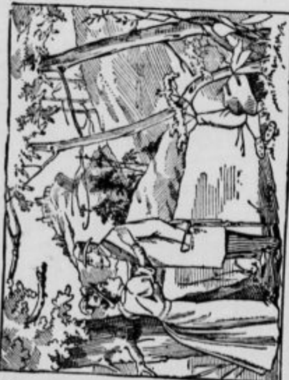
Pozdravljeni stric! — Kje so pa teta?