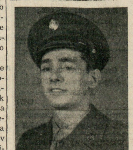
V BLAG SPOMIN OB 19. OBLETNICI ODKAR JE UMRL NAS LJUBLJENI SIN IN BRAT

MAINLINE REALTY 431-8182 221-9381 (16,18,23 sept.)