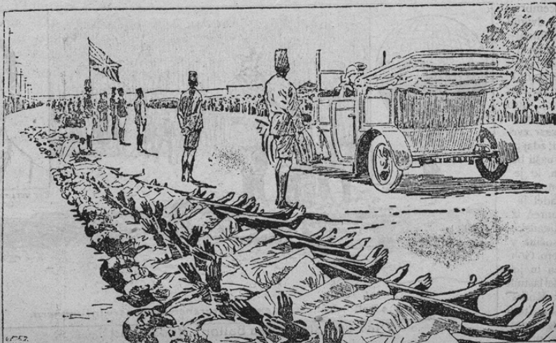
Kuriose Begrüssung des Herzogs v. Connaught durch Eingeborene des Barotselandes.

Str c angleškega kralja, vojvoda Connaughtski potoval je p. kr. po Afriki. Najbolj se je začudil v deželi Barortso nad smešnim pozdravljanjem črnih domačinov. Zamorci so namreč hoteli svoje posebno spoštovanje vojvodi na ta način izkazati, da so se pred njim na hrbet vlegli. Pri temu so kakor dojenčki z nogami brcali in svoje narodne pesmi prepevali.