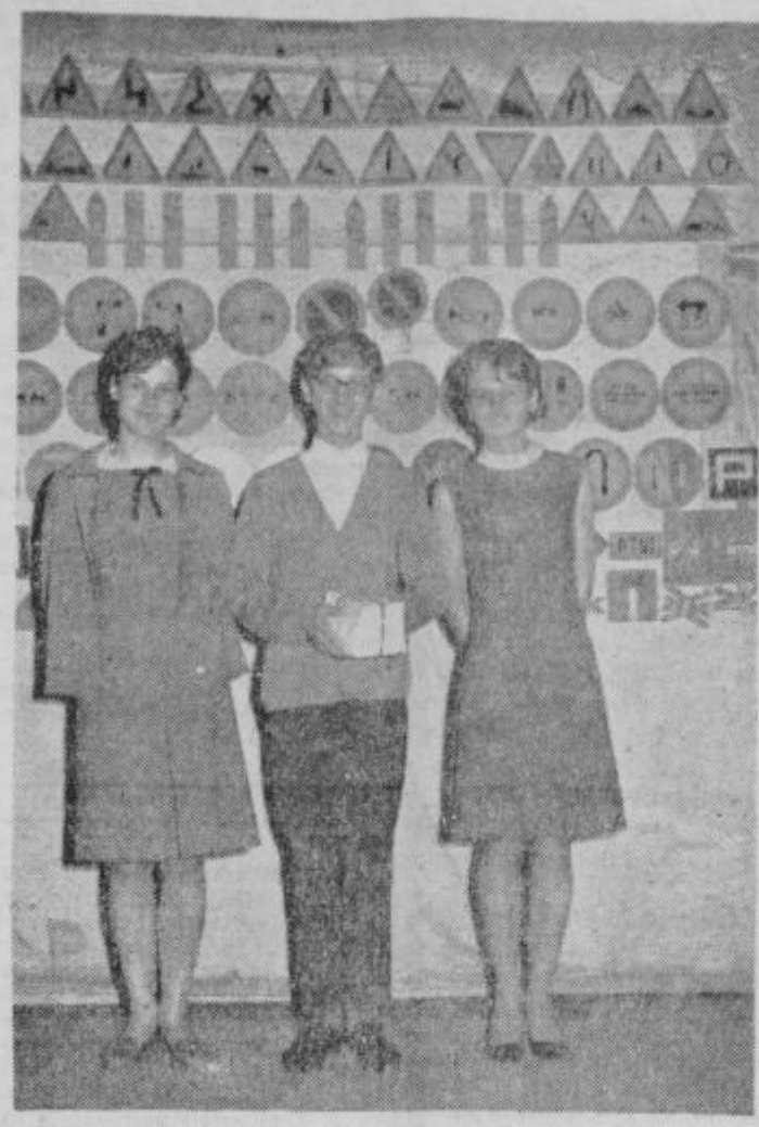
Zmagovalna ekipa tekmovanja Pokaži, kaj znaš v prometu

Pritrditev predvideva, da bi bilo letošnje jesen ponovno tekmovanje in upa, da bo zanj po vseh šolah v ptujski občini več priprav na prometno vzgojo in potem tudi na tekmovanje. Ne gre samo za to, da bodo učenci na tekmovanju pokazali, kako poznajo cestno-prometne predpi-