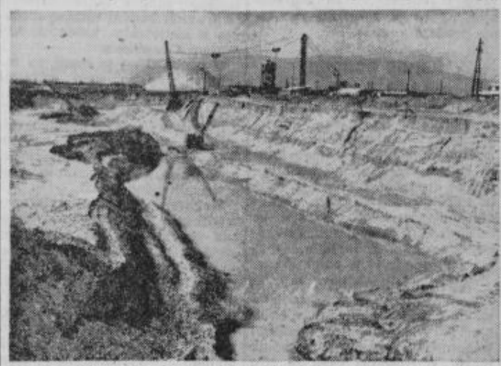
Podoba v Zlatoličju pri strojnici HC SD 1 se vsak mesec spreminja. Kar je bilo pred nekaj meseci novo, je sedaj že preteklost ki jo je razvoj prehitel.

metrov materiala, po večini gramoz. Doslej je bilo izkopanih že okrog 3 milijone kubičnih metrov. Pri teh delih si je pomagalo podjetje z bagarji in sicer s 4 bagarji s po 3 kubično žlico, ostali bagarji pa so manjši. Imajo tudi bagarje vedričarje na odvodnem kanalu za ravnanje brežine in za izkope. Na dovodnem kanalu imajo nakladače in skreperje. S slednjimi izkopavajo material in