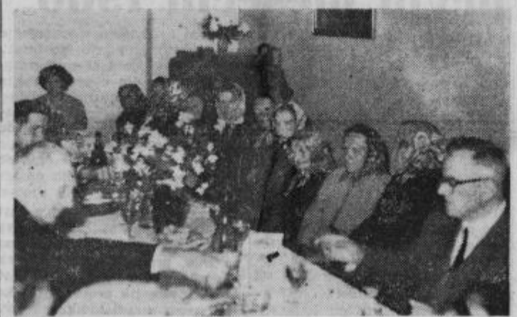
Posnetek z razdelitve odlikovanj 36 občanom ptujске občine, ki jih je odlikoval predsednik republike Josip Broz Tito z medaljo zasluga za narod, z medaljo za hrabrost in z ordenom zasluga za narod. Večina odlikovanih je s podeželja, in so mnogo pripomogli s svojim izdržanjem proti fašističnemu sovražniku in z aktivnim bojem proti njemu do končne zmage in naše svobode.