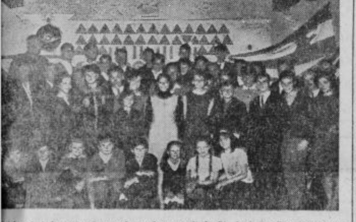
Učenci tekmovanja pod naslovom Pokaži, kaj znaš v prometu

se, temveč predvsem za to, da bo na naših cestah res red in da ne bomo plačevali tako visokega krvnega davka zaradi nepoučenosti mladine in odraslih o cestnoprometnih predpisih in pogojih varnosti za sodobni promet. Nerazumljivo je, da se je le ena šola udeležila tekmovanja z učnimi pripomočki za prometno vzgojo. Čeprav to ni zahvalo nikakršnih posebnih stroškov, saj izdelujejo največ teh pripomočkov pionirji sami. V jeseni bi naj bilo tudi za takovstno tekmovanje več enaknega razumevanja in dobre volje, kot ju je pokazala šola v Zetalah. K. D.