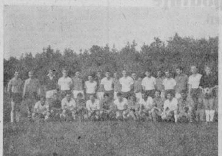
Moštvi NK Aluminija in garnizije Ptuj pred začetkom srečanja

Ze po tradiciji se ob važnejših praznikih v medsebojnem boju pomerijo nogometaši Aluminija in garnizija JLA iz Ptuja. V zadnjih letih se ta srečanja razširila in tekmujejo sedaj med sabo tudi odbojkaši, strelci in šahisti obeh ekip.