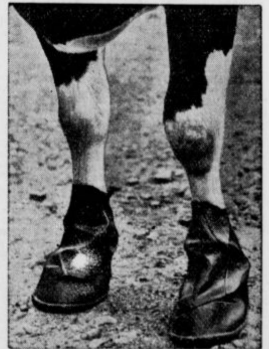
Krave bodo imele takele galoše, ki jih je iznašla neka tvrdka, da ne bodo zbolele na nogah, kar vsako leto zelo oškoduje živinorejce. Preizkusili so te galoše najprej v Angliji in so se baje izvrstno obnesle. Galoše se dajo izlahka obuti in sezuti ter krav nič ne ovirajo pri hoji.