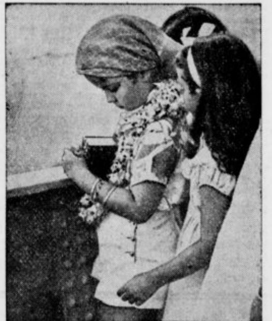
Shirley, priljubljeni ameriški filmski otrok, biva zdaj s starši na Havajskih otokih, v Honoluluju.

Ko kriza blagajniške mrzlice pojema, pomeni, da zvezda ugaja, njen uspeh raste in da je — po domače povedano — dober »kšeft«. Kadar pa krivulja blagajniške temperature pada, napravijo filmska podjetja čisto preprosto potezo: ne obnovijo kontrakta z zvezdo.