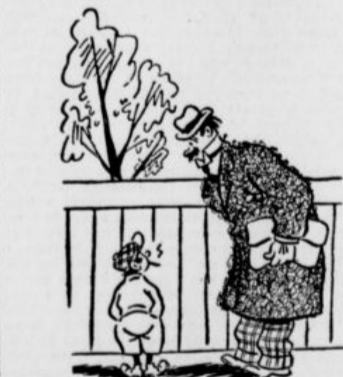
»Kaj, fantek, ti že kadiš? No, če bi bil jaz tvoj očelc »Saj bi šlo! Moja mati je vdova.«