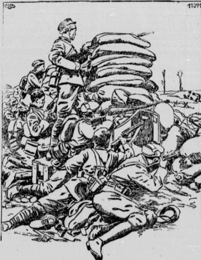
Iz bojev na Flandrskem. (Hipni posnetek.)

Petek, 3. marca: Sv. Kunigunda, cesarica. († 1040.) Sv. Andrej, mučenec. Sobota, 4. marca: Sv. Kazimir, kraljevi princ. († 1484.) Sv. Lucij, papež. Nedelja, 5. marca: (3. predpostna). Bere se evangelij o Jezusovem potovanju v Jeruzalem. Med potjo se približa mestu Jeriho. Poleg potoja je sedel slep človek, ki je prosil vbogajme. Ko je zvedel, da se Jezus bliža, začne klicati: »Jezus, sin Davidov, usmili se