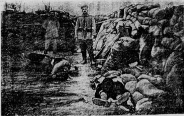
Strelski jarek pri Ypernu. Spredaj leže mrtvi Francozi.

Boji letalcev. Na vseh točkah so se metale bombe: v odseku pri Rigi in ob