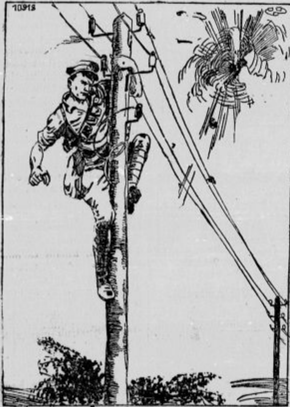
Vojak popravlja brzojavno napeljavo.

»Veseli bodo, ker bo s tem poravnano navidezno nasprotstvo in sovraštvo.«