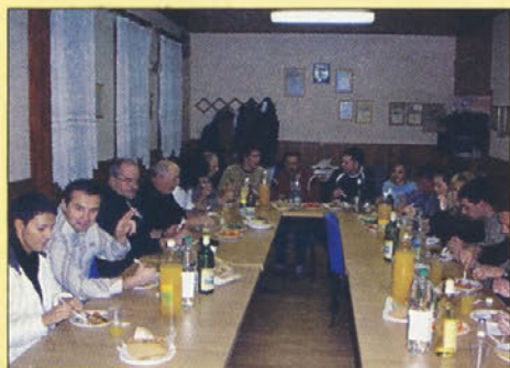
Utrinek s prednovoletnega srečanja članov ŠD Njiverce

Anton Habjanič ml., predsednik ŠD Njiverce