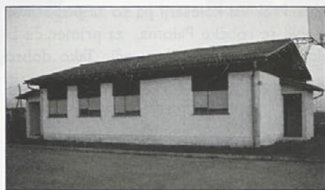
Dom vaščanov Mihovce – takšen verjetno ni v ponos občine