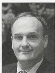
Minister Podobnik zagotovi manjkajoča sredstva za izgradnjo kanalizacije v naši občini

Ministrstvo podpira projekt Zaščita kakovosti podtalnice Dravskega in Ptujkega polja ter bo v obdobju treh let (2008–2010) zagotovilo sofinanciranje projekta in v najkrajšem času poiskalo rešitev za dodatna sredstva, ki so potrebna zaradi višje investicijske cene. S tem bi bistveno razbremenili proračun občin in s tem omogočili prepotrebno izvedbo kanalizacijskega in vodovodnega omrežja tega območja. Minister je poudaril, da je potrebno izvajalsko pogodbo čimprej podpisati in še letos uvesti izvajalca v delo.