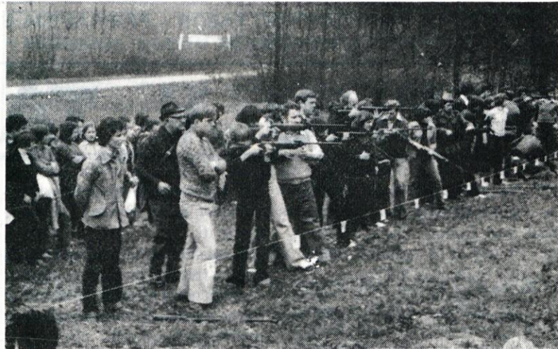
Na obrambni dan sodi tudi orožje. In ker osnovnošolci še ne morejo biti pravi vojaki, so se pomerili v streljanju le z zračno puško.