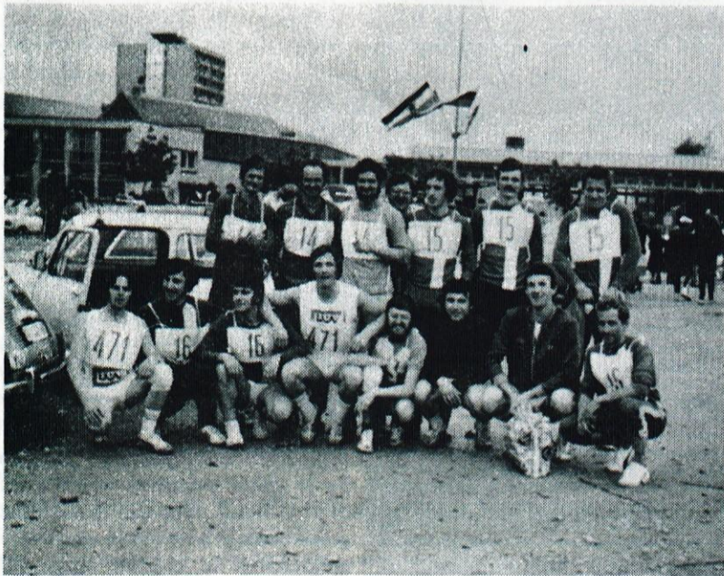
Fantje iz naše občine pred startom na Partizanskem maršu.

Mladinski odsek Planinskega društva in mladinska sekcija