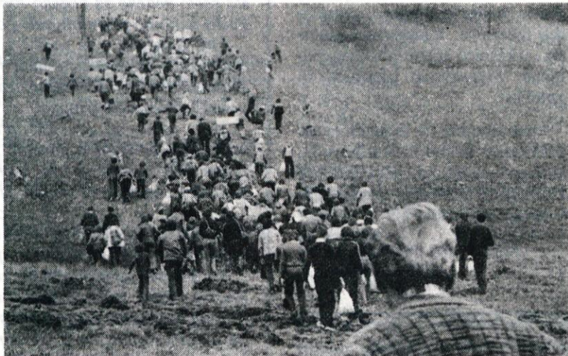
Na fotografiji se vidi samo del mladeži, ki je tisti dan s svojim veseljem napolnjevala Razorsko dolino.

Ob 10. uri so prišli učenci obeh šol. Dolga kolona pionirjev se je bližala prostoru, kjer naj bi se odvijal obrambni dan. Učenci so si najprej ogledali orožje, ki je bilo razstavljeno, nato pa so se pričele vaje v streljanju. Vojaki so streljali s svojim orožjem in učenci smo jih opazovali v varnostni razdalji. Taborniki smo gledali streljanje kar