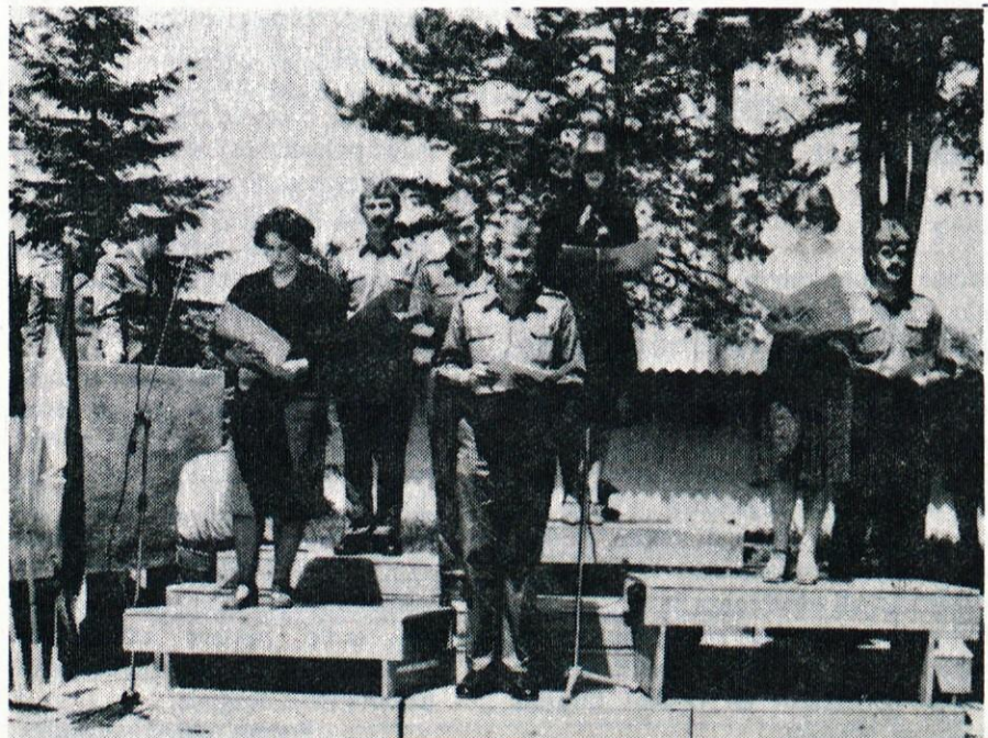
Dan mladosti so praznovali tudi naši vojak. Fotografija je iz kasarne Ivan Cankar, kjer so skupaj z mladimi pripravili recital o tovarišu Titu.