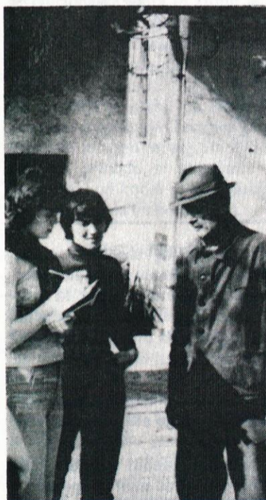
Mladi raziskovalci so z zanimanjem poslušali vaščane

ki ga v Verdu ni bilo težko vzpostaviti. Poleg spoznanega večera smo skupaj na predvečer 1. maja prižgali kres na Ljubljanskem vrhu, imeli piknik v Retovju, odigrali prijateljsko nogometno tekmo, med plesom v mladinskem klubu pa smo se pomerili v kvizu iz spretnosti in znanja.