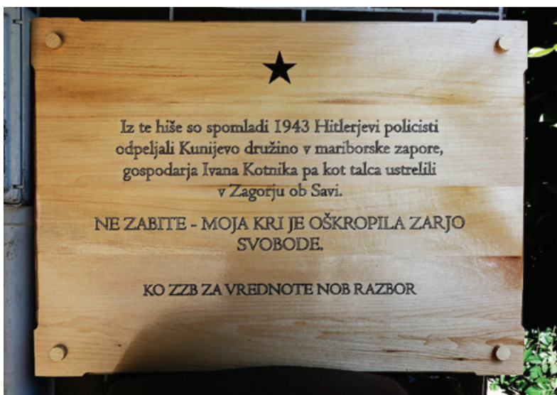
Spominska plošča na Kunejevi hiši