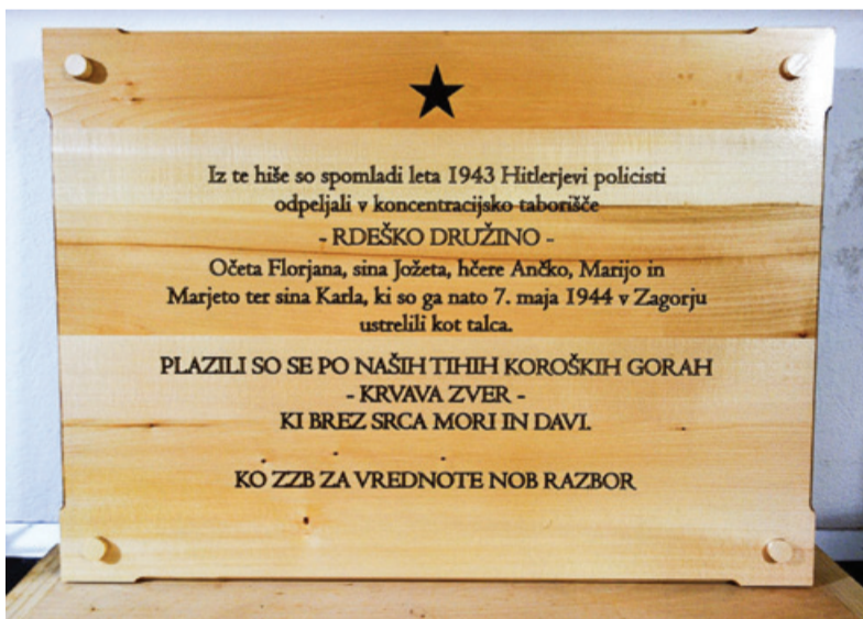
Spominska plošča na Rdeški hiši