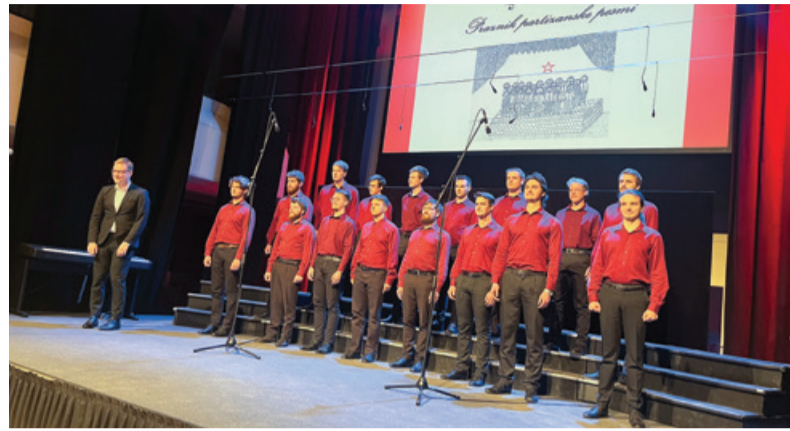
Primorski akademski zbor Vinko Vodopivec

Nastopili so Partizanski pevski zbor, Ljubljana; Ženski pevski zbor Laniške predice, Škofljica; Mešani pevski zbor DU Kranj; Moški pevski zbor KD Tine Kos, Moravče; Seniorski pevski zbor Glasbene matice, Ljubljana; Moški pevski zbor MAJ, Kranj; Ženska vokalna skupina Zimzelen, Nova Gorica; Primorski akademski zbor Vinko Vodopivec, Ljubljana. Vsak zbor je zapel tri pesmi. Omeniti velja, da so Seniorski pevski zbor Glasbene matice in oba zbora iz Kranja na prazniku nastopili prvič.