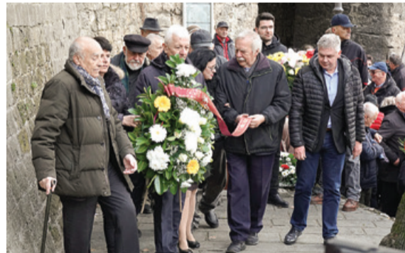
Polaganje venca – delegacija borčevskih organizacij iz nekdanje Jugoslavije

80 let je letos minilo od drugega zasedanja Avnoja, ki je bilo 29. novembra 1943 v Jajcu v Bosni. Antifašistični svet narodne osvoboditve Jugoslavije je bil ustanovljen leto prej, na prvem zasedanju v Bihaču 26. novembra 1942.