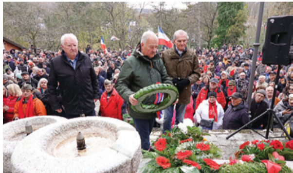
Polaganje venca – delegacija ZB NOB Ljubljana, KO Zadobrova - Sneberje