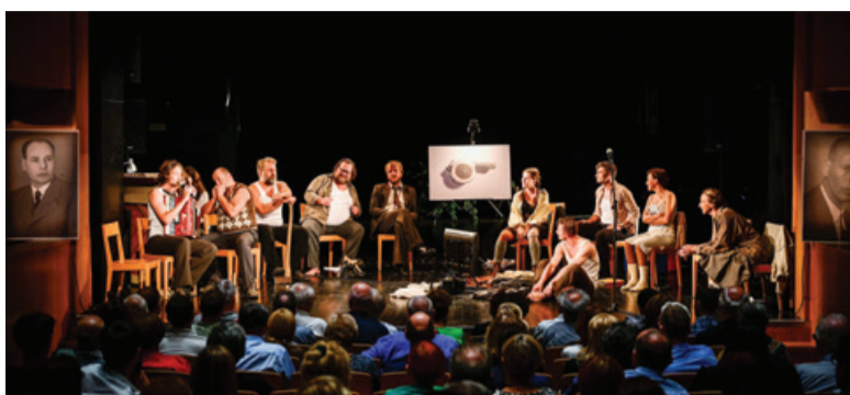
Predstava v ptujskem gledališču

»8. januarja 1943 je okoli 2000 pripadnikov okupatorske vojske obkolovalo bataljonski tabor pri Osankarici. Spopad se je začel malo pred poldnevom. V srditi poslednji bitki, ki je trajala dve uri in pol, je bilo ubitih 69 borcev, poslednjega pa so okupatorji ranjenega ujeli in usmrtili kot talca.