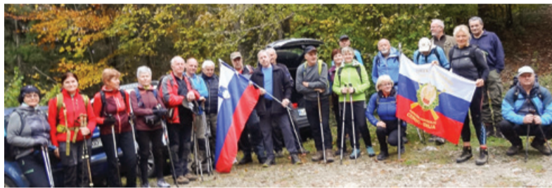
Začetek pohoda po Idrijskih Krnicah