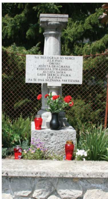
Spominsko obeležje obešenim partizanom

Danes se lahko samo vprašamo, kako so jih trpinčili pred smrtjo, saj obesiti človeka na dober meter visoko ograjo ni tako lahko. Najmanj štiri so morali potiskati telo proti tlo. Groza, vendar taka je vsaka vojna: kruta, neizprosna in ponižujoča. Tri dni so žrtve morale viseti