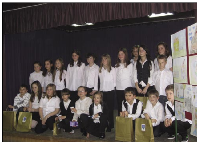
Vsi udeleženci tekmovanja in njihove risbe, ki so jih pripravili kot ilustracije k pesmim Srečni zmagovalci

nem domu je torej šlo zares. Tekmovalci so bili razdeljeni v 3 skupine: prvo- in drugošolci, tretje- in četrtošolci ter peto- in šestošolci. Vsaka skupina je imela primerno obvezno pesem, vsak tekmovalec