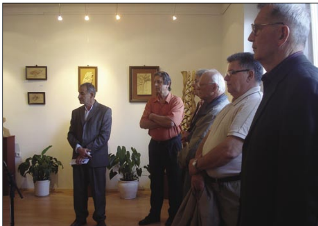
En del ustvarjalcev na otvoritvi razstave

Na razstavi v Lipi lahko zasledimo realistične in