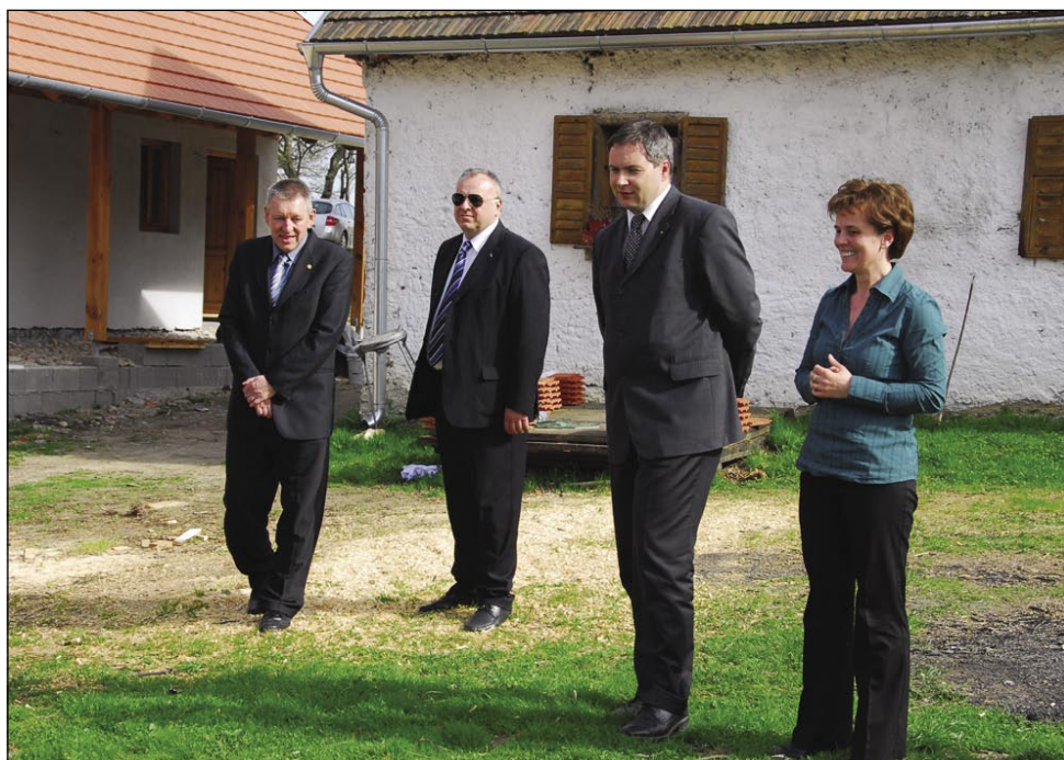
V Andovcih na ogledu Hiše rokodelstva, ki se gradi ob stari domačiji

jo evropskih sredstev to 100-odstotno sofinancira, drugi pa da polovico sredstev prispeva lastnik kmetije,« je razložil Dejan Židan in dodal, da naj bi z izvajanjem investicije začeli novembra ali decembra letos, njen zaključek in s tem vzpostavitev proizvodnje pa je nato predviden v roku enega leta.