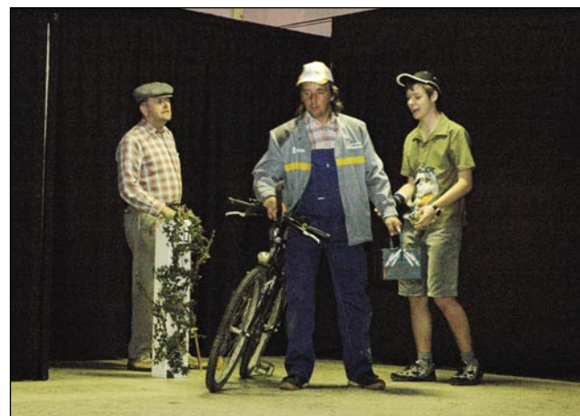
Ferari trbej popraviti