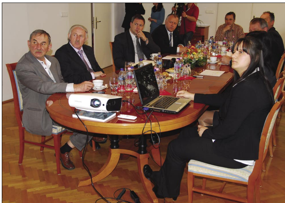
Udeleženci pogovora na Generalnem konzulatu RS v Monoštru

Po ministrovih besedah omenjeni projekt, ki je zasnovan v obliki mešane kmetije – le-ta se bo ukvarjala z živinorejo in sadjarstvom – dobro napreduje. Kmetijsko-gozdarski zavod Maribor in Razvojna agencija Slovenska krajina sta pripravila poslovni model, ki vključuje 15 krav dojilj, jagodičevje in travniške sadovnjake, kar naj bi omogočilo dobičkonosno proizvodnjo na kmetiji. »Trenutni izračuni kažejo, da bo potrebno investirati 170 tisoč evrov, pri čemer obstajata dve možnosti, da Slovenija s pomoč-