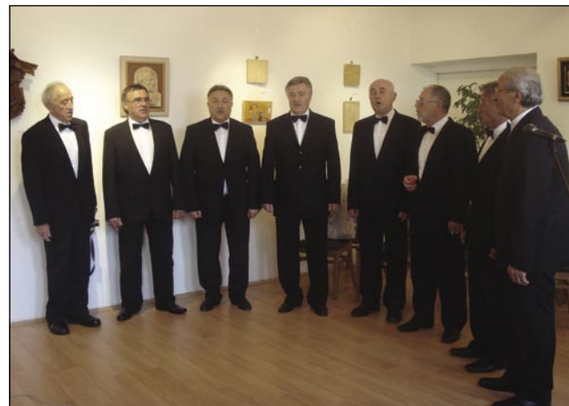
Za kulturni program je poskrbel Oktet Studenci