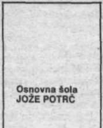
Osnovna šola JOŽE POTRC