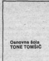
Osnovna šola TONE TOMŠIČ