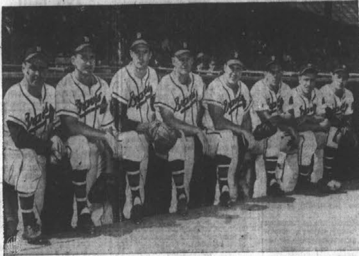
PENNANT-BOUND —Disregarding the well-known hex that may fall upon them, the pennant-bound Boston Braves pose for cameraman. Left to right, they are: Tommy Holmes, right field; Alvin Dark, shortstop; Earl Torgeson, first base; Bob Elliott, third base; Jeff Heath, left field; Mike McCormick, center field; Phil Masi, catcher, and Sibby Sisti, second base. Sisti has been filling in for the injured Eddie Stanky.