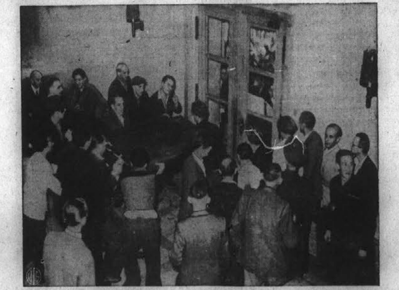
Komunistični razgrajči v Berlinu. — Komunisti v Berlinu so že večkrat poskušali z razgrajanjem ovirati zborovanje nekomunističnega mestnega zastopstva v mestni hiši v Berlinu. Zgornjo skupino rdečih razgrajčev je ujel fotograf na film pri njih nasilnem razgrajanju v mestni hiši 6. septembra.

Dolžnost nas vseh je, da pomagamo v kampanji "The Com-munity Chest of Greater Cleveland," ki bo trajala od 18. do 28. oktobra.