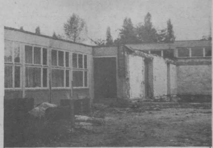
SANIRANJE VVZ ANGELCE OČEPEK – Najbolj poškodovani del stavbe je porušen – to je prva faza sanacijskih del na poškodovanem poslopiju vrtca Angelce Očepek. V drugi fazi bodo popravili poškodovani obstoječi del stavbe z okrepitvijo temeljev, sten, centralnih sanitarij, inštalacij itd. Ta dela bodo končana do konca leta. Za tretjo fazo je v načrtu gradnja novega dela stavbe, ki je sedaj porušena. Pričetek del bo mogoč, ko bodo zagotovljena sredstva. Od 800 starih milijonov, kolikor bo stala celotna sanacija, manjka še 150 starih milijonov.

Zgrajeni objekti – Iz programa gradnje osnovnih šol od 1972 do 1974 je zgrajenih 6 šol