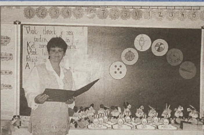
Učiteljica J. b razreda OŠ Savo Kladnik Sevnica z zajčki in malce treme pričakuje novo generacijo prvošolčkov.