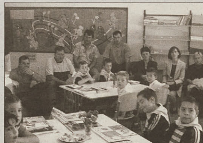
In takole je bilo v čisto "navadnem" 1. razredu na OŠ Velika Dolina. Petnajst učencev osemletke si bo reklo sošolec-sošolka.