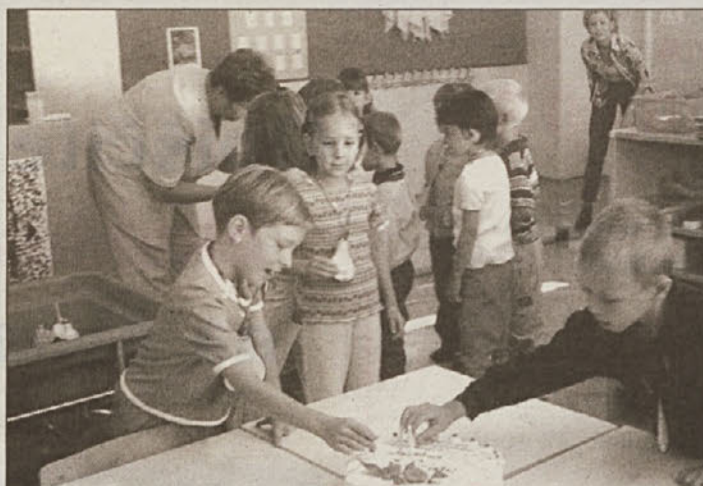
Torta se mora okrasiti tudi s svečkami, to so storili učenci sami. Vseh enajst. Potem se svečke prižgejo in nato še upihnejo. Za srečo.