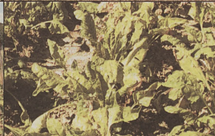
Takšne so posledice suše na kmetijskih pridelkih.

Slovenija, Posavje – Slovensko kmetijstvo preživlja težke čase. Za učinkovite strukturne spremembe, ki jih zahteva Evropska unija (EU) je v državnem proračunu premalo denarja. Kmetje trdijo, da od Evrope prevzemamo samo zahteve, za ugodnosti, ki jih