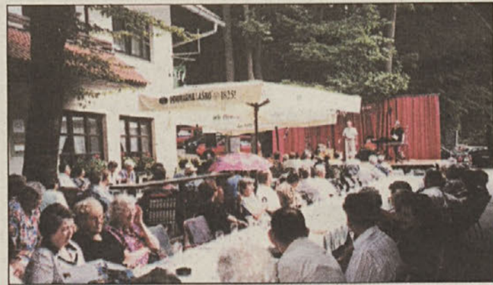
Tudi na ribniku pri Brestanici so upokojenci dokazali, da se znajo še kako dobro zabavati.