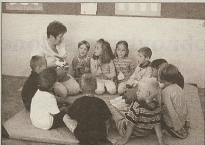
OŠ Velika Dolina je zakorakala v novo poglavje šolanja. Enajst malčkov 1. razreda devetletke je pozorno prisluhnilo svoji učiteljici.

Počitnice so se iztekle. Bile so dolge, vroče, prijetne, za marsikoga nepozabne. Sklepala so se nova poznanstva, nova prijateljstva, morda tudi nove...no, saj veste kaj. Zdaj pa je tega lepega dolgega, vročega razkošja konec. Kajti vsega lepega je enkrat konec. Zakorakali smo v novo šolsko leto. Nekateri otroci so, bolj ko se je iztekal mesec avgust, vse bolj nestrpno čakali prvi šolski dan. Želeli so svoja doživetja deliti s prijatelji, sošolci, tudi z učitelji in učiteljicami. Še posebno nestrpno so začetek pouka čakali tisti malčki, ki so si šolske torbice oprtali prvič. Postali so prvošolčki, nanje pa bomo v teh dneh in v novem šolskem letu še posebno pozorni. No, in kakšno je bilo na prvi šolski dan vzdušje? To nam bodo povedale fotografije. Bili smo v vseh treh posavskih občinah in zabeležili razpoloženje in utrip prvega šolskega dne.