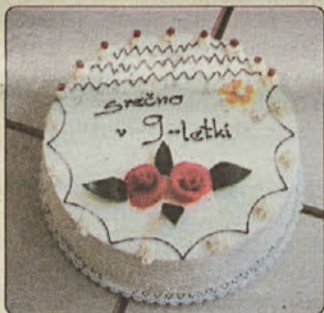
Na OŠ Velika Dolina je bil praznik. Devetletkarji so prestopili prag šole, zato so si zaslužili torto.