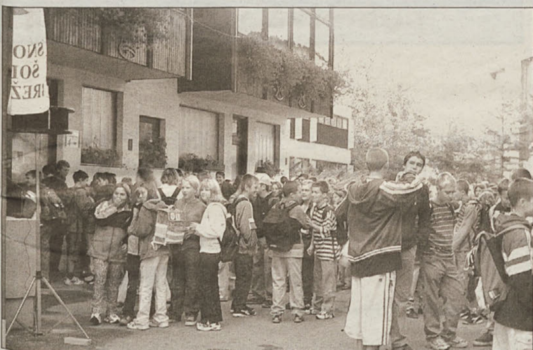
Ob osmi uri zjutraj se je pred OŠ Brežice trlo učencev. Kar težko so pričakali prvi dan novega šolskega leta, prijateljstvo dolgo niso videli.