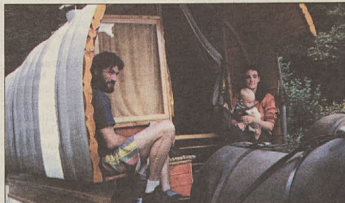
Dom na štirih kolesih