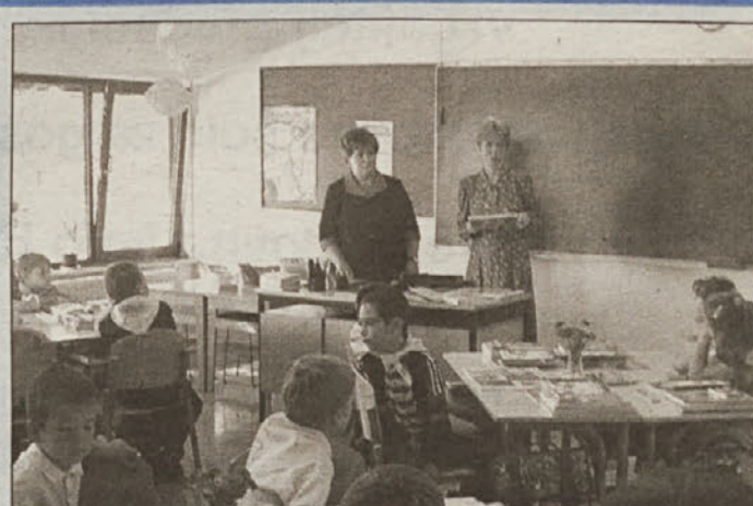
Tako starši kot tudi učenci so pozorno prisluhnili razredničarki, kaj bodo v šoli potrebovali. Prvošolci so od zdaj prepoznavni z rumeno rutico.