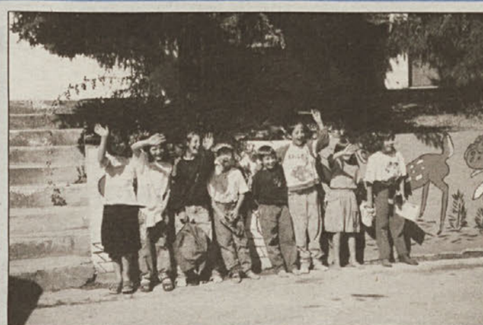
Z razposajenim mahanjem romski šolarji, ki obiskujejo OŠ Leskovec, kažejo veselje ob ponovnem pričetku pouka.