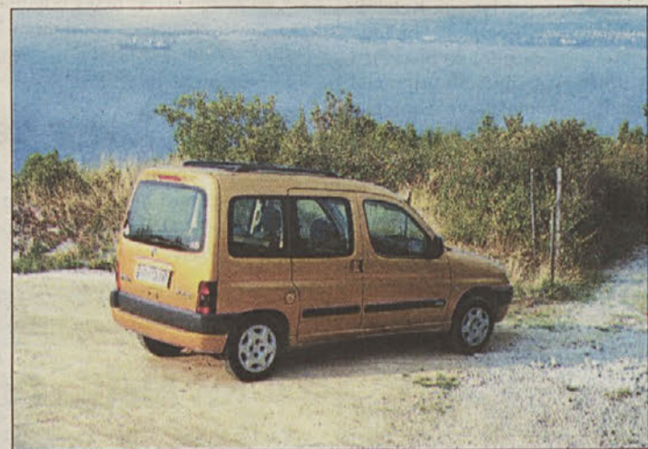
CITROËN BERLINGO 1.6 16V Modutop

skrajnem primeru lahko v Berlingo zložimo skoraj 3 m 3 tovora. To