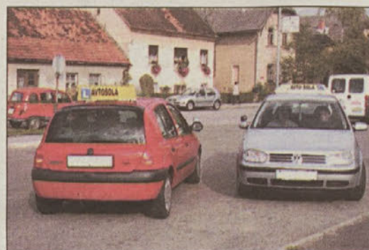
Lahko avtošole kandidate pripravijo "realnost" na cesti?

Za izdajo sklepa o predhodni oz. začasni odredbi skladno z ZIZ so praviloma stvarno pristojni izvršilni oddelki okrajnih sodišč, njihova krajevna pristojnost pa se presoja glede na varstvo predhodne oz. začasne odredbe. Pri nepremičninah je pristojno okrajno sodišče, kjer nepremičnina leži, pri premičninah pa po prebivališču oz. sedežu dolžnika. Če je bila vložena tožba za izdajo predhodne oz. začasne odredbe, ne odloča o tem izvršilno sodišče temveč redno sodišče, ki je pristojno za rešitev spora.