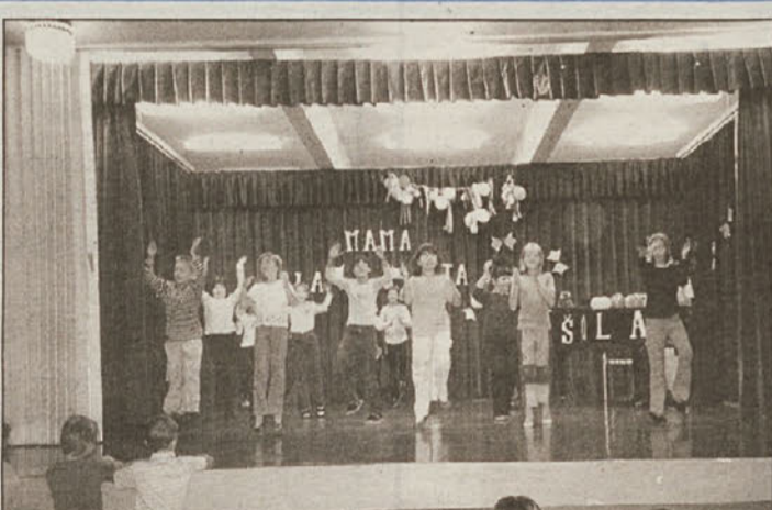
Prvošolcem v Leskovcu so na prvi šolski dan nadvse lep sprejem pripravili učenci, ki bodo v letošnjem šolskem letu obiskovali 2. razred.