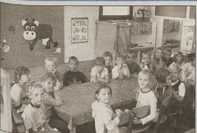
Mali šolarji iz VVZ Najdihojca Dobova se imenujejo Čebelice. Veseli so bili našega obiska in prijazno so se odzvali povabilu za fotografiranje.