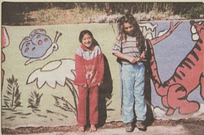
Romski šolarji obiskujeta nižjo stopnjo OŠ Leskovec. Prvi šolski dan sta lepo napravljena pristali na "poziranje".

Posavje – Mnogi so težko pričakovali ponedeljek, dan, ko se je začelo novo šolsko leto 2001/2. Morda med vsemi najtežje so ta dan pričakovali vsi tisti malčki, ki so si prvič v življenju oprtali šolske torbice in se podali k novemu in neznanemu. Prestopili so prag "velike šole", zdaj pa bodo znanje zajemali z "veliko žlico". Prvi šolski dan je bil res nekaj posebnega. Otroci so prejeli rumene rutice, s katerimi so prepoznavni, vozniki na cestah pa bodo nanje še posebno pozorni.