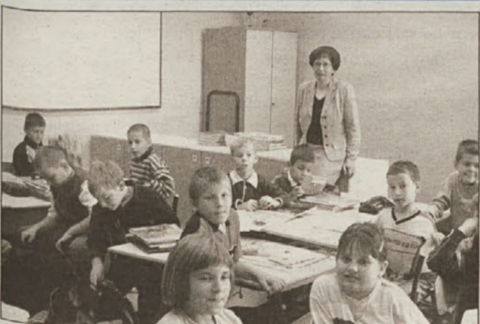
V 2. razredu je vse drugače kot leto prej. Dobovski učenci so skupaj s svojo razredničarko ogledovali, kakšni so letošnji učbeniki.