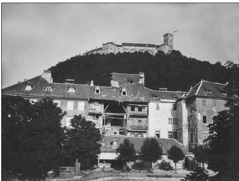
Francevo nabrežje (današnje Cankarjevo) in zadaj Ljubljanski grad

Na pomoč so ponesrečenim v potresu prišle vse tri oblasti, občinska, deželna in državna. Sprva se je največ energije vložilo v direktno pomoč ponesrečenim v potresu – od zasilnih nastanitev, hrane, vode do denarne pomoči. Kmalu po potresu pa so se začele voditi bolj dolgoročne politike. Za vzor je bila večkrat postavljena modernizacija Zagreba 451 po potresu leta 1880. Že na prvi popotresni seji mestnega sveta se je predlagalo, da se prosi državne oblasti za brezobrestno posojilo, da bi se kot Zagreb lahko modernizirala tudi Ljubljana. 452