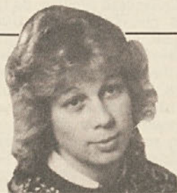
PIŠE HEIDI STINGLER