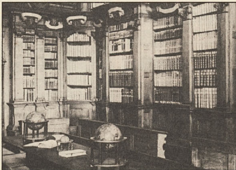
Pogled na del semeniške knjižnice v Ljubljani

Sredi Ljubljane je torej ostala knjižnica takšna, kakršno so v prvi polovici 18. stoletja uredili prizadevni člani Akademije operozov, kar bi po slovensko rekli družba delovnih mož. Prva javna znanstvena knjižnica v slovenski prestolnici, je vsekakor velika kulturna dragocenost, na to spoznanje pa v hlastanju za potrošniškimi dobrinami večkrat radi pozabljamo.