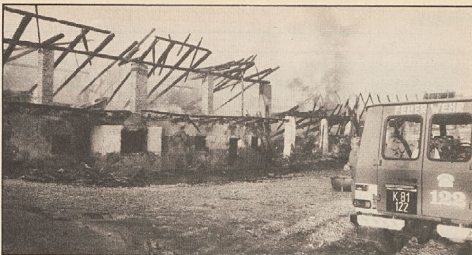
V ponedeljek, 23. 9., je pogorela Kuharjeva domačija v Črgovičah pri Šmihelu. Škode je približno 5 milijonov šilingov, gasilci so mogli rešiti samo še stanovanjsko hišo in sosedna poslopja. Požar so po vsej verjetnosti povzročili otroci pri igranju.

Poštnina plačana v gotovini Celovec P.b.b. Erscheinungsort Klagenfurt Verlagspostamt 9020 Klagenfurt