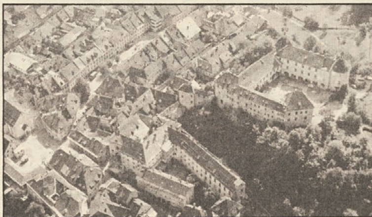
Škofjeloška panorama iz zraka; staro mestno jedro z gradom na Krancju

Ker prostor znotraj mestnega obzidja ni dopuščal, da bi stavbe kaj prida spreminjali, je Loka do danes ohranila svojo starinsko podobo, posebno še, ker se je tudi industrializacija nekako izognila mestu. Šele to stoletje je v Loko pritegnilo industrijo in se je mesto precej razširilo, k sreči pa so se meščani že zavedali izjemnih vrednot tisočletnega kraja, zato so staro mestno jedro zaščitili kot kulturno-zgodovinski spomenik. Tako je stari del Škofje Loke eno najbolje ohranjenih srednjeveških mest v Sloveniji, posebno še, ker so za tisočletnico (1973. leta) očistili Mestni Trg mlajših dodatkov in mu vrnilo prvotno podobo.