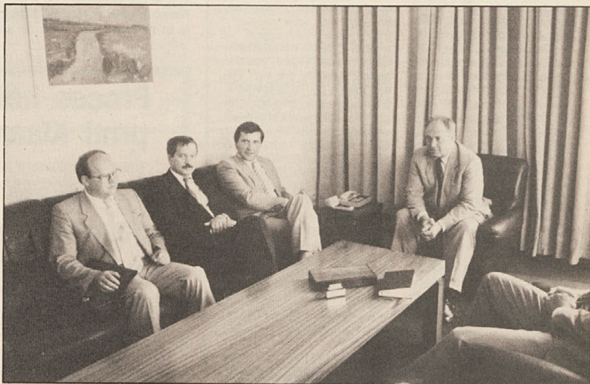
Brez pogovorov med priznanim slovenskim vodstvom in deželnim glavarjem oz. vlado pač ne bo šlo.