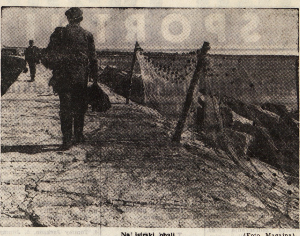
Na istrski obali