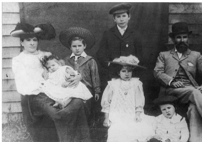
Slika 2. Obitelj Radonich podrijetlom iz Dubrovnika krajem 19. stoljeća u Australiji

Slijedeći veći val iseljavanja odnosi se na razdoblje između 1918. i 1945. godine kada Hrvati zbog dvaju svjetskih ratova, velike gospodarske krize tridesetih godina prošlog stoljeća, političkih previranja u domovini, te teritorijalnih promjena iseljavaju prema Australiji, ali i drugim prekoceanskim zemljama. Dalje se smatra kako je novi značajniji iseljenički val Hrvata prema Australiji započeo 1948. godine iz izbjegličkih kampova u Italiji i Austriji (koji su se počeli zatvarati početkom 1950-tih godina), kako ne bi bili vraćeni u “Titovu Jugoslaviju”. U razdoblju od 1954. do 1960. godine započelo je novo iseljavanje Hrvata prema Australiji, zbog komunističkog režima u tadašnjoj Jugoslaviji. Između 1960. i 1973. godine u Australiju je stigao novi val Hrvata zbog ekonomske (privredna i društvena reforma, viškovi radnika u industriji, velika nezaposlenost itd.), ali i političke situacije (hrvatsko proljeće) u matičnoj domovini. Za iseljavanje Hrvata prema Australiji koje je započelo osamdesetih godina prošlog stoljeća i nakon 1990. godine (zbog krize kasnog komunizma i kasnije zbog ratnih zbivanja na tlu Republike Hrvatske) može se reći da još uvijek traje iako manjim intenzitetom.