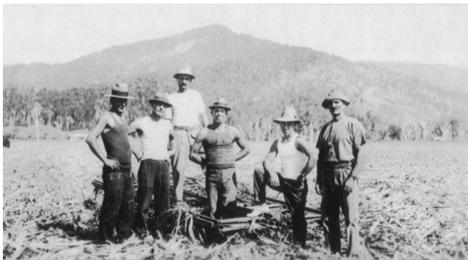
Slika 1. Starija generacija hrvatskih iseljenika u Australiji krajem 19. stoljeća

Povjesničari izdvajaju šest većih valova iseljavanja Hrvata u Australiju. Razdoblje od 1890. do 1918. godine smatraju prvim većim valom iseljavanja, a uslijedio je zbog teške gospodarske situacije u matičnoj zemlji. Iseljavanje Hrvata je bilo usmjereno prema zapadnom dijelu Australije zbog posla u rudnicima zlata, opala i na sječi šuma. Dakle, u prvom valu iseljavanja prema Australiji emigracija je bila uvjetovana odlaskom hrvatskih ljudi “trbuhom za kruhom”, ali istodobno i pojavom tzv. austral-ske zlatne groznice.