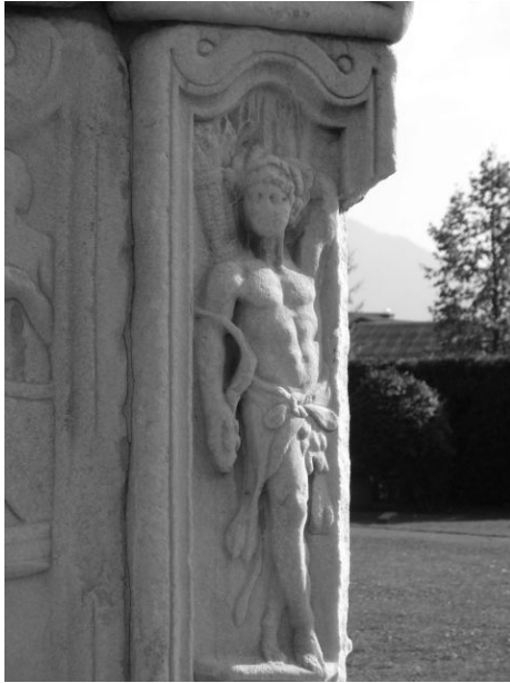
Slika 3: Poletje, leva spodnja bočna stranice grobnice Spektacijev, začetek 3. stoletja, Šempeter v Savinjski dolini.