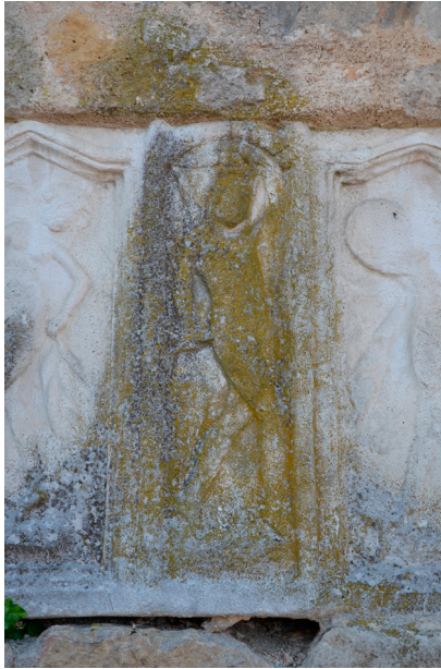
Slika 1: Satir, del edikulne grobnice, zgodnje seversko obdobje, Hartberg, stopnišče ob župnijski cerkvi sv. Martina.