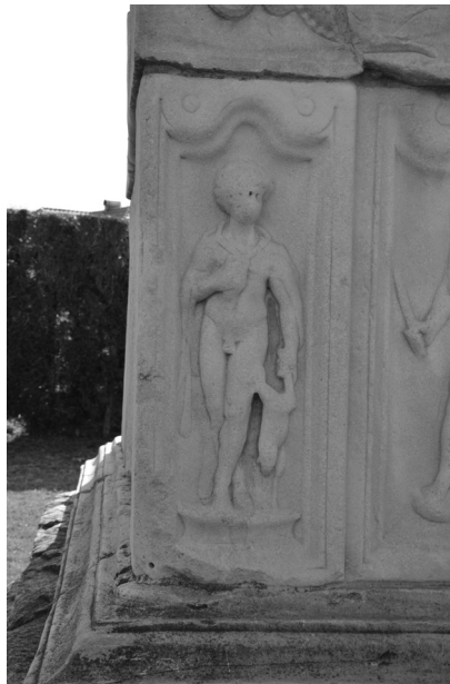
Slika 2: Pomlad, leva spodnja bočna stranice grobnice Spektacijev, začetek 3. stoletja, Šempeter v Savinjski dolini.