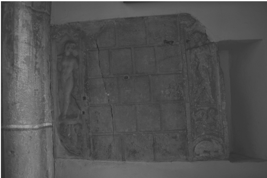
Slika 6: Satira, del edikulne grobnice, prva polovica 3. stoletja, Šentvid na Glini, vzidana v cerkev sv. Jakoba Starejšega.