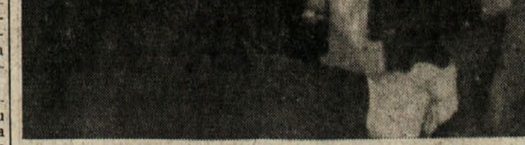
Prisrčno srečanje med iranskim šahom Pahlavijem (levo) in kitajskim predsednikom Huom-fengom (desno) na teheranskem letališču