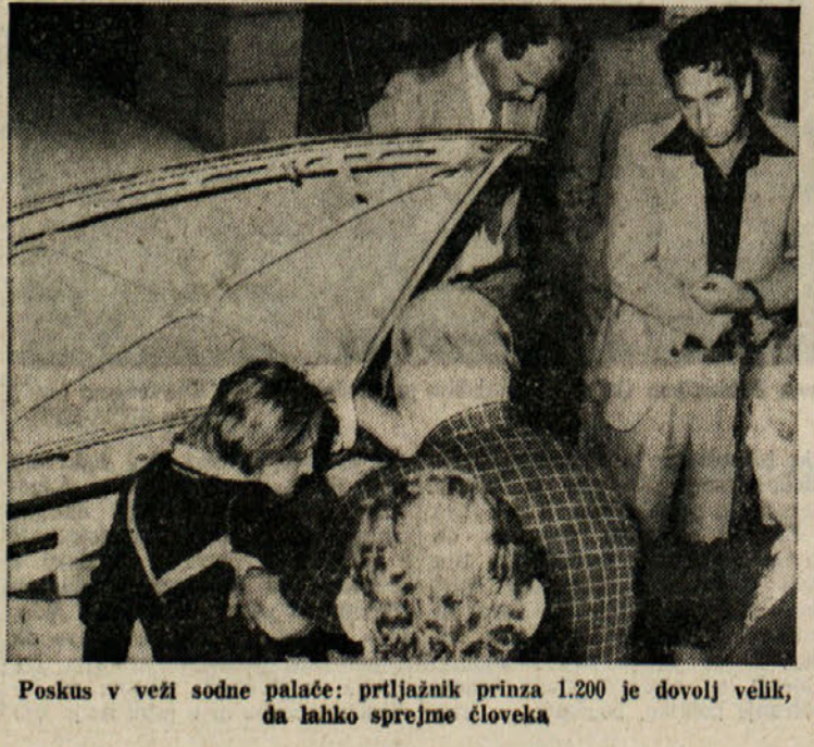
Poskus v veži sodne palače: prtljajnik prinza 1.200 je dovolj velik, da lahko sprejme človeka.