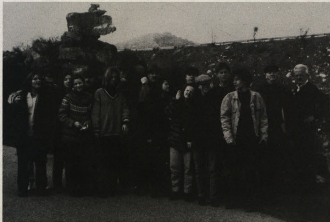
Šentjanščani z režiserjem Petrom Militarovom so si ogledali tudi pokrajino.

otok z 23.000 km 2 in poldrugim milijonom prebivalcev, z zelo staro kulturo, ki seže nazaj vsaj 7000 let. Podnebje je subtropsko ali tropsko, prav tako je tudi vegetacija. Prebivalci se močno razlikujejo od ostale Italije! Sardski jezik je bolj arhaičen. Ohranili so ga in svojo kulturo