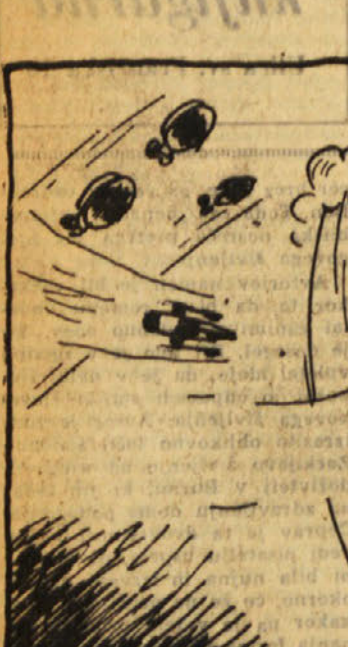
Raketa je poletela. Potniki so vedeli, da še niso rešeni. Vsi Argošaški so bili v zraku in samo imeno njih so lahko pobegnili v svobodo. Peter je prvi zaklical: »Argošaški so pred nami. Povečanje hitrosti! Kakor puščica so zleteli mimo osuplih sovražnikov.