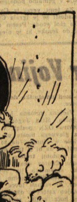
Končno so se Argošaški ne znašli in jih pričeli zasledovati z svojo vojsko. Vendar se je raketa čedalje bolj odmakala od njih. Pod seboj so že zagledali okrogli planet. »Over, to je Zemlja!« sta zaklicala Peter in Aleš hkrati.

Agenti omenjenih avtomobilov pa niso vedeli za to novost in so se zato začudeno spraševali, kaj pomenijo razna naročila za epize, ki so jih slišali na svojih sprejemnikih, namesto običajnih smernic za posege v te ali oni mestni četrti. Slišali so namreč take pozive: »Takoj eno epizoo na številko 220 v 42. etetu na vzhodu itd. Lastnik restavracije «Rocky Lee Chu-Chu Whites, katerega specialiteta je omenjena neapeljska jed, je prišel na pametno zamisel, da bi imel mnogo več prometa, če bi uvedel kar potujoče epizerie. Kupil je avtomobile s priklopicami (roulottes), na katere je namestil pekače za epize, kakor tudi sprejemne in oddajne radijske aparate. Klient samo telefonira na številko «Plaza 3-4858», ki odgovarja centralni razdeljevalni sistemski eradiopize. Centrala odda naročilo po radiu roulotte, ki je najbližja klientovemu naslovu in avto naglo zapelje proti cilju, medtem ko kuhar zamesti in vliže v pekač posebno epizoo s sirom, sardelami, klobasicami, reseklimim mesom itd.