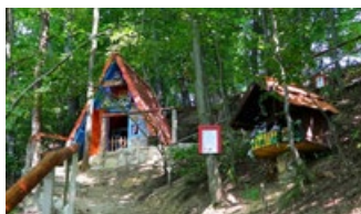
LUTKOVNA PREDSTAVA GLEDALIŠČA MAJE FURLAN, 1. 5., 15.00 Pravljnični gozd "Rdeča kapica"