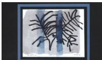
OTVORITEV RAZSTAVE DEL UPORABNIKOV ZUDV DORNAVA 5. 5., 18.00 CID Ptuj