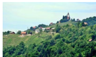
40 LET OBSTOJA HALOŠKE PLANINSKE POTI 27. 5., 7.30–17.00 Zbirališče: železniška postaja Ptuj