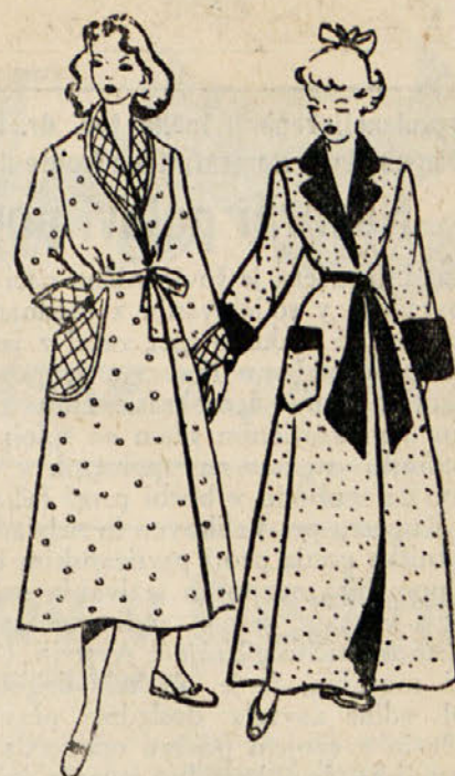
Levo: Jutranjka iz vzorčastega barhenta z dolgim ovratnikom, zavihki na rokavih in velikim žepom iz preštepanega enobarvnega blaga.

Nadev: nato omelete drobno zreži in vmešaj med smetano, s tem namaži omelete. Na mizo lahko daš tople pa tudi mrzle, same ali s kompotom.