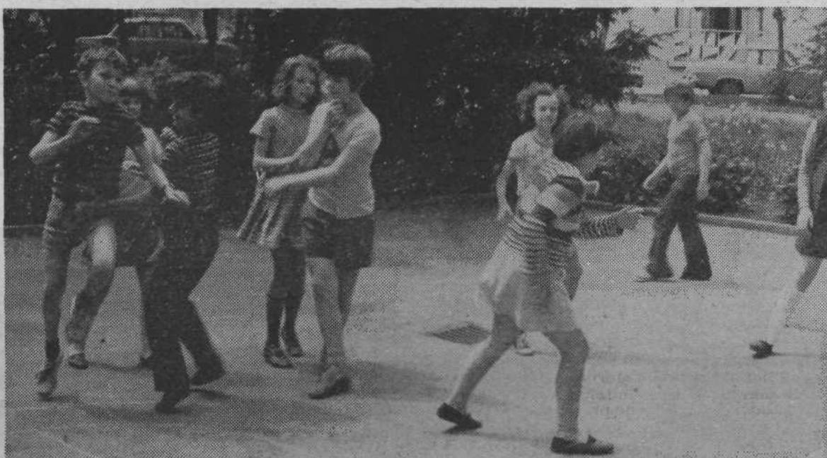
Pred kratkim je bila še topla jesen. Zdaj pa je listje že odpadlo in počakati bomo morali kar pol leta, da bo podoba Tivolija spet približno taka, kot je bila še v zadnjih jesenskih dneh.

Sedaj jim je, tako kot nekoč, zaplala kri. Dosti jih je, ki so presenečeni, ker niso vedeli, da še toliko zmorejo in da še niso popolnoma za staro šaro. V družbi svojih somišljenikov jim pravzaprav nič ne manjka.