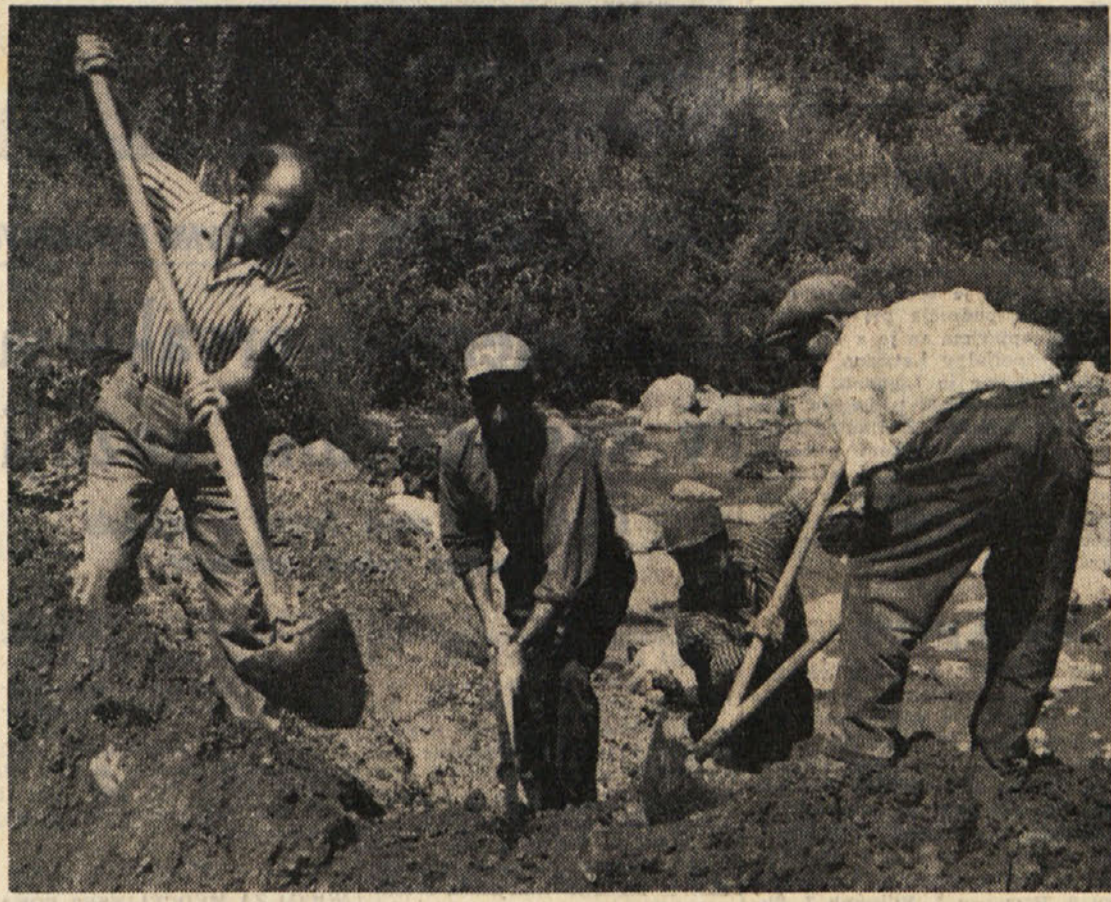
Na sliki vidimo nekaj delavcev, ki kopljejo v strugi reke Busento pri Cosenzi. Nekateri arheologi in geologi so mnenja, da je na tem mestu bil L. 410 pokopani Alarik, kralj Gotov. Zdjaj skušajo, da bi odkrili njegovo grobnico, ozroma njegove ostanke.

Vodstvo organizacije je pred kratkim imelo sestanke v Taizu, kjer je ponovno pozvalo vse ostale osvobodilne sile juga, da se pridružijo organizaciji. Poziv se predvsem nanaša na tako imenovano Osvobodilno fronto, ki je bila ustanovljena lani in je doslej svojo dejavnost razvijala neodvisno. Predstavniki Osvobodilne organizacije okupiranega juga v Kaibu izjavljajo, da lahko pride no ob obdobja za morebitna pogajanja z Britanijo samo iz Londona. Poudarjajo pa obenem, da je — še preden pride do kakršnega koli resnega pogajanja v zvezi z neodvisnostjo — kot minimum potrebno, da britanska vlada sprejme priporočila, ki jih je s tem v zvezi bila dala OZN. Ta priporočila predvidevajo odpravo izrednih policijskih ukrepov, svobodno volitve pod nadzorstvom svetovne organizacije ter umik britanskih vojaških sil iz oporišča v Adenu. Na preliminarinih razgovorih v Londonu prejšnji mesec, je Britanija zavrnila zahtevo po odpravi izrednih ukrepov in evakuacije v adenskem oporišču. Razgovori so potem najprej pretrgali predstavniki Osvobodilne organizacije, nato pa se predstavniki sedanjeg esamoupravne vlade v Adenu ter vzhodnih protektoratov. Britanijo so podprli samo sultan in šejki zahodnih protektoratov, ki jih je bil postavljen London. Po sedanjih ocenah so perspektive poznejanja slabe, v kolikor bi Velika Britanija ne sprejela svoje politike in ne spremeni stališča v zvezi z neodvisnostjo. Po drugi strani, pa perspektiva miru v Jemenu daje osvobodilnim silam juga novega impulza.