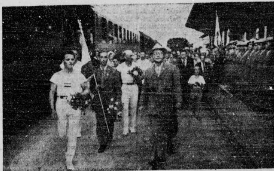
Slovenski fantje, zmagovalci na mednarodni tekmi v Franciji ob slovesnem sprejemu po povratku v domovino na ljubljanskem kolodvoru.