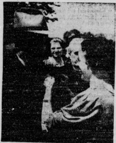
Blike z dekliškega tabora na Brezjah: Nagelček, roženkravi, rožmarin - iz tega Ti pušlec naredim

n Pri reševanju sestrice je utonil. Betnavski ribnik na Tezmem pri Mariboru je znan kot zahrbtn in za kopalce nevaren ter zahteva vsako leto nekaj žrtev. Kljub nevarnosti in vsem opozorilom se ljudje kopljejo v