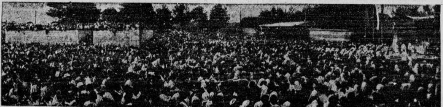
Nad 12.000 deklet je v nedeljo 24. julija 1938 pri Materi božji na Bresjah prisegalo svoje svetostbo veri in domovini.