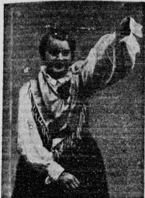
Vsa pošena dekleta k nam! v naših vrstah je slovenska mladina!