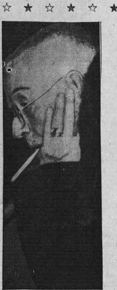
Švedski kralj Gustav z zanimanjem prisostvuje tennisu