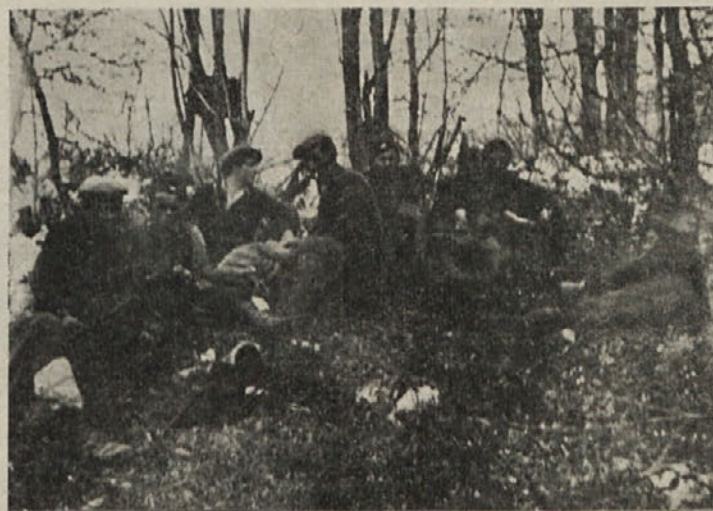
Rodoljubi so se pred sovražnikovim divjanjem zatekli v gozdove in odločno prijeli za orožje

Odkar so odšli iz naših krajev Kočevjarji, je pokopališče na Vidmu zanemarjeno. Sedaj ga prebivalci Čepelj, Vimola, Kraljev, Brezovice in Nemške loke urejujejo s prostovoljnim delom.