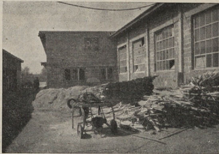
Inlesov obrat HRASST v Dolnji vasi

dila v specializacijo proizvodnje (na posameznih obratih bi izdelovali le nekatere artikle in ne na vseh vse, kakor je še sedaj). S tem računajo na občuten dvig proizvodnje in strojne opremljenosti na evropski nivo. Tak razvoj jim narekuje današnje tržišče in ekonomičnost. Za to pa so potrebni strokovni kadri, ki jih Inles nima, je pa zainteresiran, da koristi posamezne biroje in službe v okviru poslovnega združenja (tehnoški biro, komercialni-nabavno uvozniki in ekonomski biro).