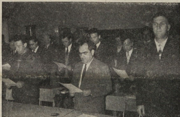
»Prisegam, da bom zvesto služil ljudstvu...«

PRVA SEJA NOVE OBCINSKE SKUPSCINE V RIBNICI