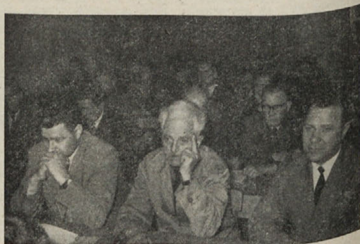
Udeleženci skupščine med razpravo