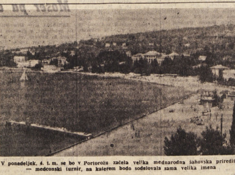
V ponedeljek, 4. t. m. se bo v Portorožu začela velika mednarodna šahovska prireditelva...