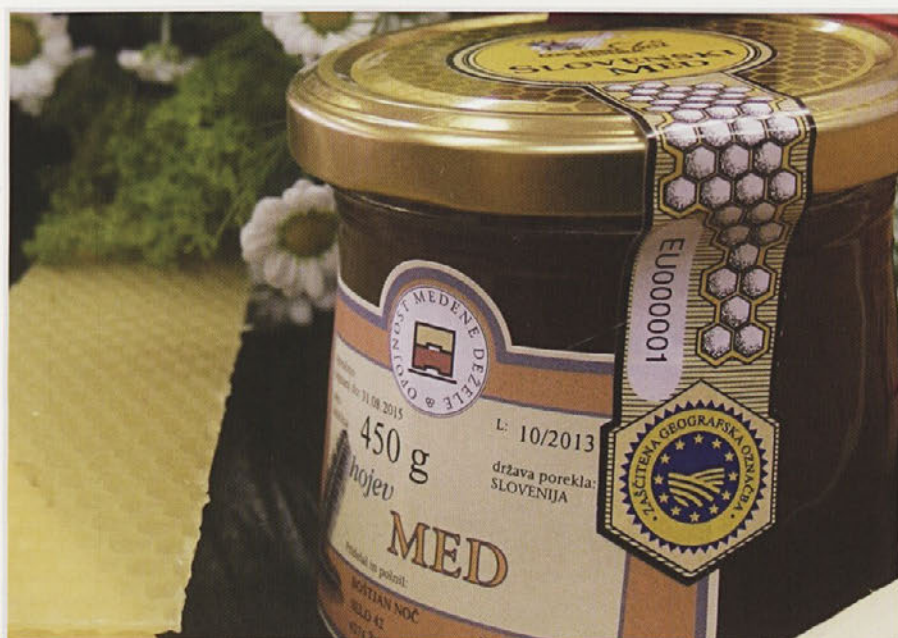
Geografska označba SMGO

Med proizvajajo čebele. Na rastlinah nabirajo nektar ali medicino, ki jo izločajo rastline v nektarjih, ali pa pobirajo mano. Mana je izloček posebnih žuželk, ki sesajo rastlinski sok, izločajo pa sladko tekočino, ki jo poberejo čebele. Tako glede na izvor ločimo cvetlični med in med iz mane. Cvetlični med je