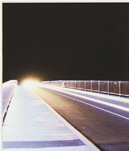
Most čez kanal v Gorišnici je že rekonstruiran, kmalu bo tudi v Zagojičjih

Občina je objavila na Portalu javnih naročil Obvestilo o naročilu pod št. JN004870/2016-B01, dne 24.8.2016, za projekt »Vaški dom Tivolci«. Prispelo je šest ponudb. Izvaja se postopek preverjanja ponudb in ponudnikov ter izbira ponudnika. Najugodnejša ponudba znaša 239.632,96 €. Rok za izvedbo del je 31.10.2017.