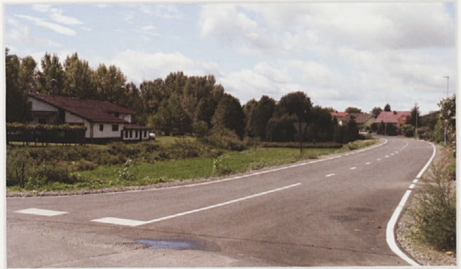
Cesta na Forminu

Občina je dela oddala na podlagi Pogodbe z dne 11.8.2016, KOMUNALNEMU PODJETJU PTUJ d.d., Puhova ulica 10, 2250 Ptuj in sicer na podlagi 28. člena ZJN-3 na podlagi in-house razmerja.