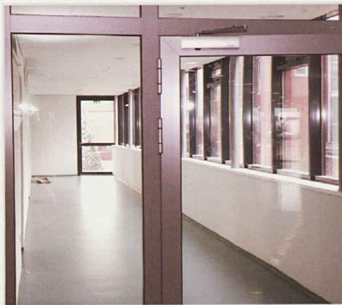
Osnovna šola Gorišnica je z rekonstrukcijo bogatejša za tri učilnice in kabinet