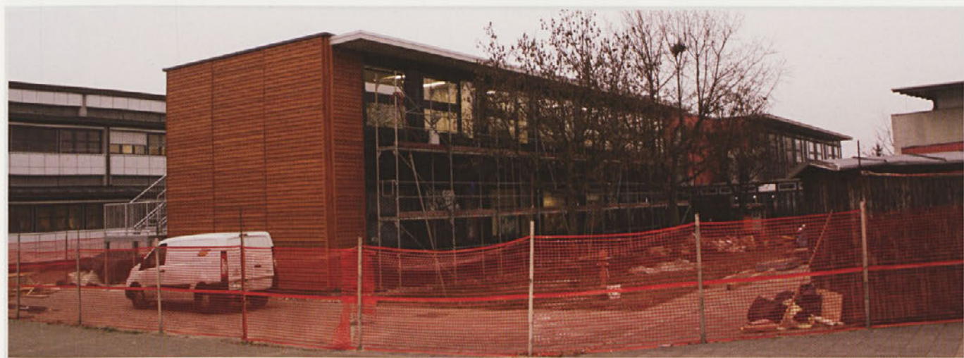
Zaključuje se dograditev osnovne šole Gorišnica