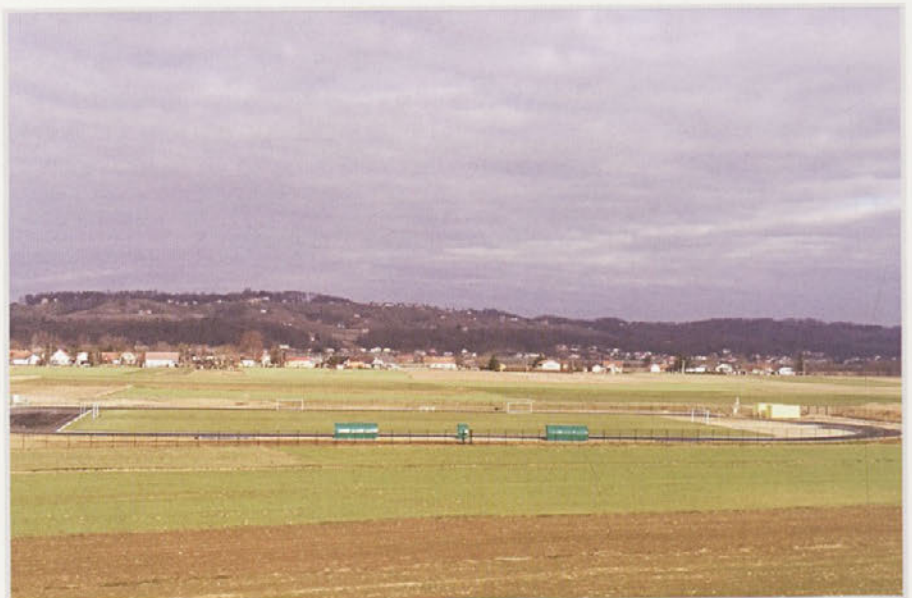
Na atletske stezi je položena asfaltna podlaga

investicije v posodabljanje športnih objektov in vgrajene športne opreme v letu 2016, št. 4110-92/2016-109, z dne 2.11.2016, dobila odobrena sredstva za sofinanciranje v višini 39.316,48 €. Zahtevek za sredstva je bil v skladu s Pogodbo št. C3330-16-064229, o zagotavljanju sredstev za sofinanciranje investicij v posodabljanje športnih objektov in vgrajene športne opreme v letu 2016, podpisane dne 15.11.2016 z Ministrstvom za izobraževanje, znanost in šport, poslan dne 22.11.2016.