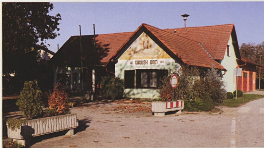
Gasilski dom v Zagojičjih bo kmalu zamenjan z novo zgradbo