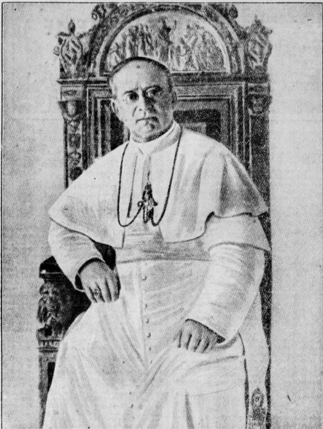
Dne 6. februarja je minilo 14 let, ko je bil izvoljen za papeža sedanji sv. Oče Pij XI, ki je dne 12. februarja nastopil prestol Petrovih naslednikov.