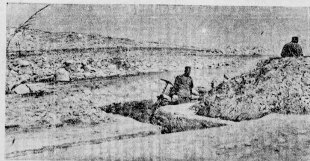
Egiptska meja zavarovana. V zadnjih časih so Angleži zelo zavarovali egiptsko-libijsko mejo. Da bi bili bolj zavarovani, če bi izbruhnila kakva vojna. To je prva slika, ki kaže, kako domačini tam na meji ko plijejo jarke.

»Posodi mi deset dinarjev, a mi jih daj le pet! Potem bom jaz tebi dolžan pet dinarjev, ti meni pet, pa bova bot!«